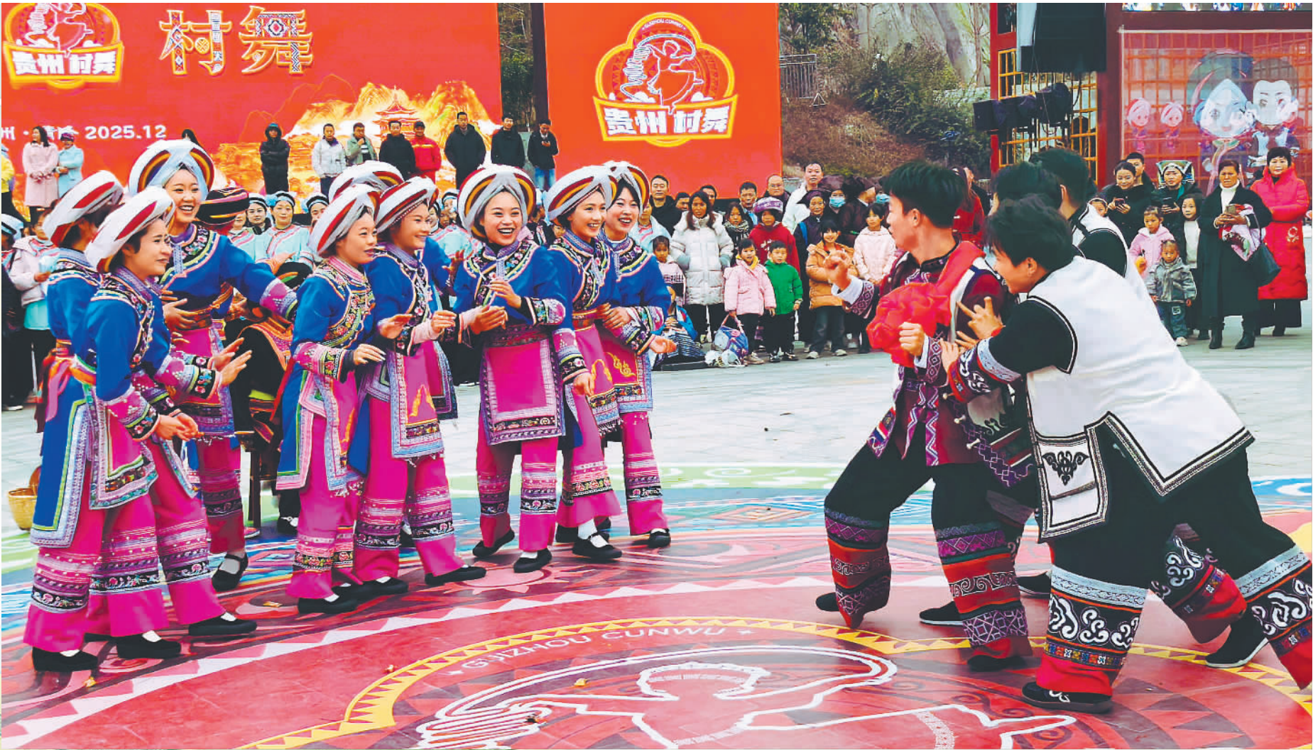
▲2025年12月27日,演员在贵州黔西南州晴隆县阿妹戚托小镇村舞活动中表演《阿妹戚托》。阿妹戚托为彝语音译,意为姑娘出嫁舞,是晴隆传统民间舞蹈,入选国家级非物质文化遗产名录。

榕江县依托“村超”赛事,打造“赛事观赏+特产选购+非遗体验”的多元消费场景,带动一批农业龙头企业、农民专业合作社和家庭农场等经营主体快速成长。台江县依托“村BA”品牌效应,推动农业与文化产业、乡村旅游、休闲体育、生态康养、农村电商等深度融合,打造“赛事周边”文创产品,带动苗绣、银饰、蜡染等民族特色产品热销,促进乡村产业由“传统种养主导”向“多元产业协同发展”转型。