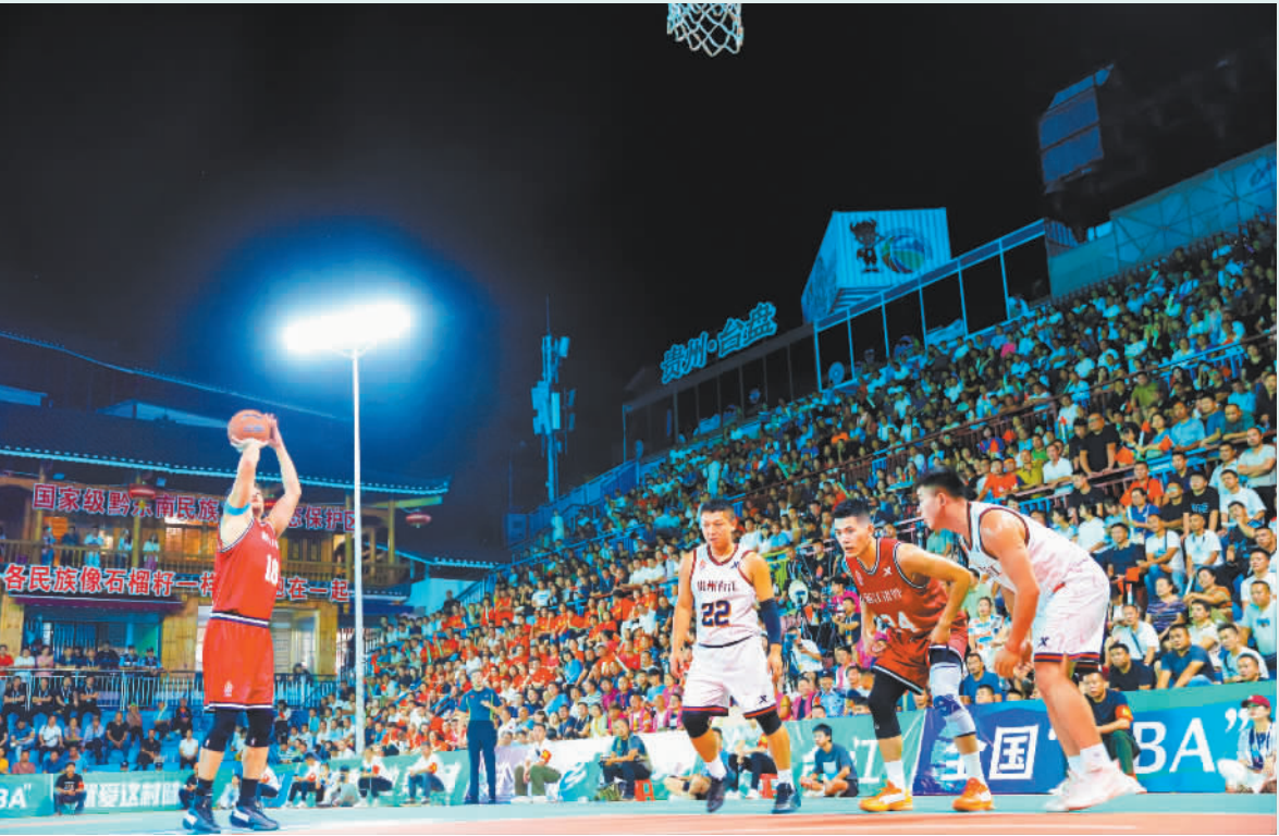
▼2025年10月12日,全国和美乡村篮球大赛(村BA)总决赛在黔东南州台江县台盘村开赛。台盘村目前已累计举办了2000余场“村BA”比赛,并将经验推广至全国22个省区市。