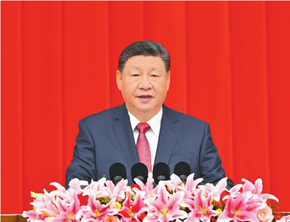
12月31日,全国政协在北京举行新年茶话会。中共中央总书记、国家主席、中央军委主席习近平在茶话会上发表重要讲话。