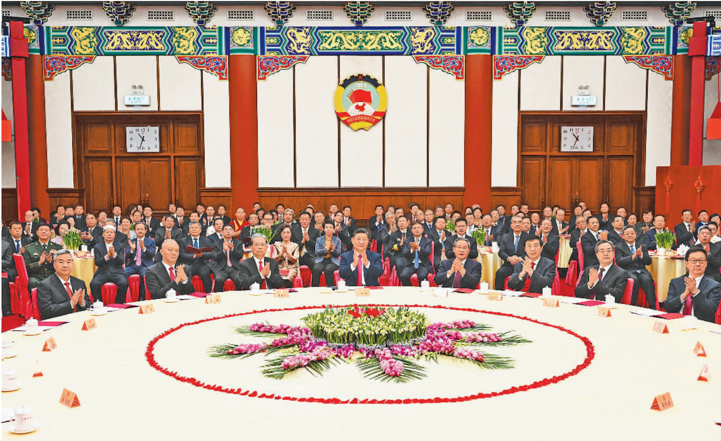
12月31日,全国政协在北京举行新年茶话会。党和国家领导人习近平、李强、赵乐际、王沪宁、蔡奇、丁薛祥、李希、韩正出席茶话会并观看演出。