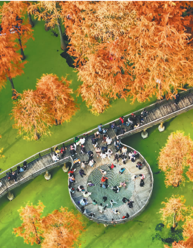
冬日美景吸引游客前来游玩观赏，展现取得新成效。