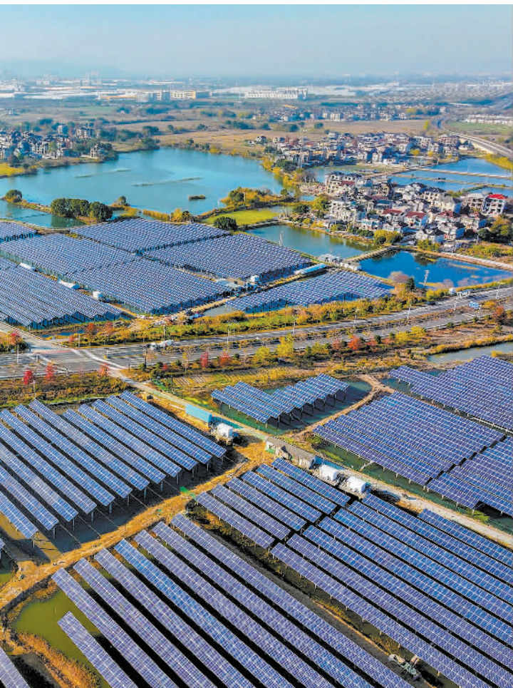
益县当地利用河塘水库

将政策善意转化为市场佳作,仍需依靠监管部门、企业与社会三方的协同推进。监管部门应在鼓励创新的同时,加快建立科学、审慎且高效的产品评价与监管标准,严守安全底线;企业则需投入真研发、摒弃短视营销,真正围绕老年群体皮肤生理特点,在原料技术、制剂工艺、包装设计等环节开展系统创新;社会舆论也应营造更加包容多元的审美氛围,打破对年龄的刻板印象,让追求美丽成为一项贯穿生命全周期的自然权利。唯有各方形成合力,才能让老年群体的“美丽需求”得到充分满足,让“银发经济”与“美丽经济”碰撞出更多精彩火花。