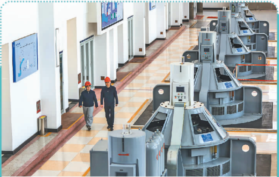
位于江苏省扬州市的江都水利枢纽，工作人员在抽水站主机层巡视检查。

党的二十届四中全会通过的《中共中央关于制定国民经济和社会发展第十五个五年规划的建议》提出，加快建设现代化水网，增强洪涝灾害防御、水资源统筹调配、城乡供水保障能力。水利部相关负责人表示，水利部聚焦重要经济区、重要城市群、能源基地、粮食主产区、重点生态功能区布局了一批重大工程，不断推进国家骨干网与省市县水网互联互通、丰枯调剂、有序循环，南北调配、东西互济的水资源配置网络格局加快形成，预计到今年年底国家水网覆盖率达80.3%。