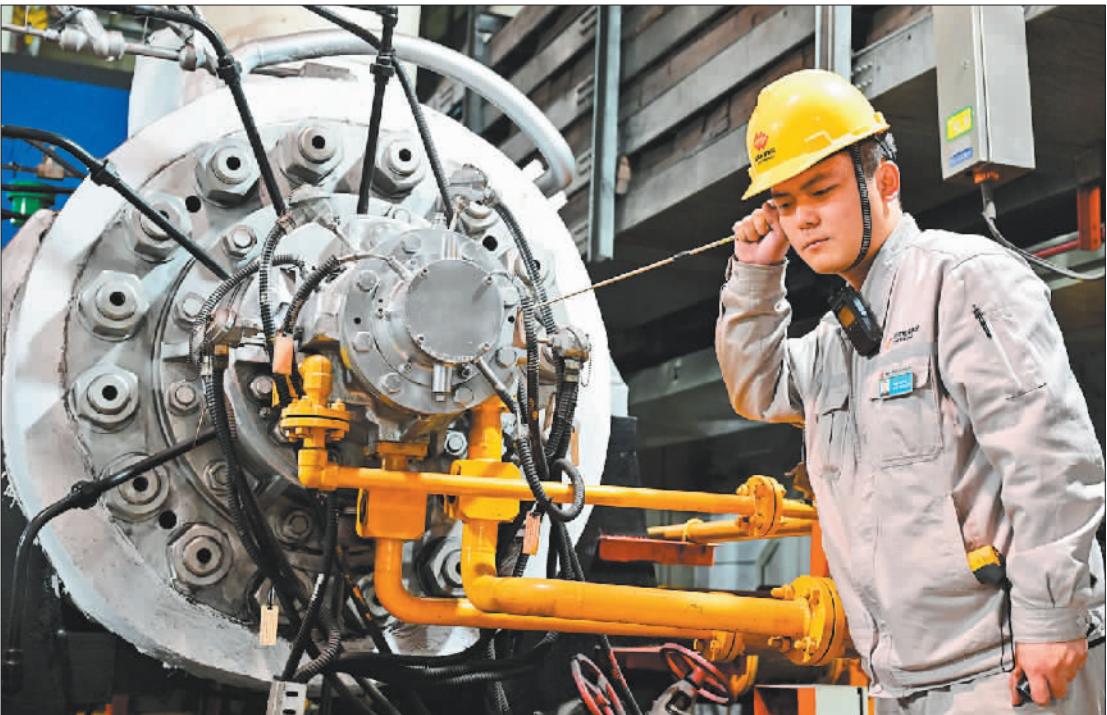
▼11月28日,国能宁夏灵武发电有限公司员工在检查发电及供暖设备运行情况,确保人民群众温暖过冬。