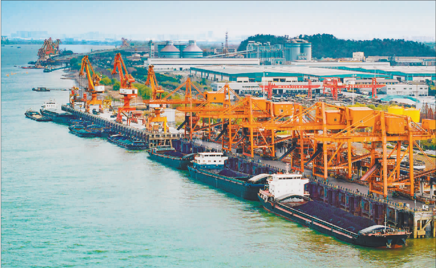
◀12月12日,位于安徽省马鞍山市长江岸线的马鞍山港,电煤正有序卸运。寒潮来袭,马鞍山市供电部门开辟电煤“绿色通道”,全力保障电煤运输安全、畅通、高效。