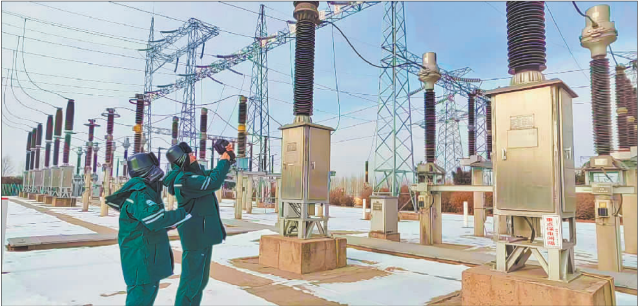
▼12月15日,吉林省长春市五棵树220千伏变电站,国网长春供电公司变电运维员使用红外测温仪等工具巡查设备,保障降雪降温天气变电站安全运行。