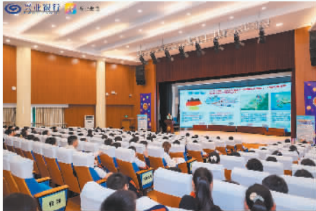
2025年10月,兴业银行信用卡中心联合多方机构走进同济大学附属七一中学(初中部)开展“金融安全伴成长”主题活动

近日,市民李先生(化名)被各类贷款推销电话骚扰得不胜其烦。他没想到一次看似随意的点击,竟把自己拽进了“免息费”的陷阱。