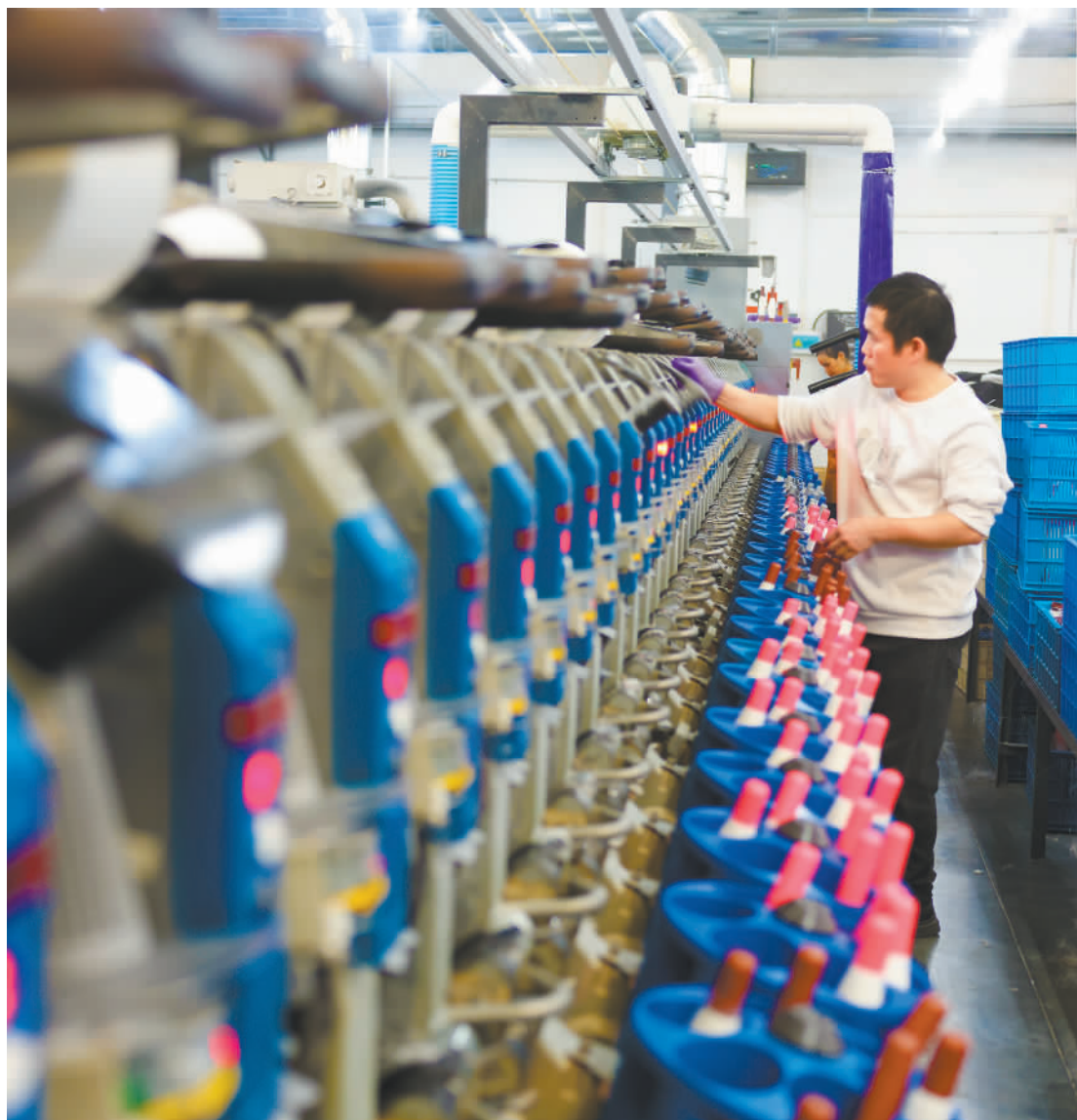
◀11月27日,位于湖北省咸宁市咸安区的湖北精亚麻业有限公司,工人在生产车间忙碌。该公司创新应用苕麻、亚麻等传统原料,不断开发适销对路和高附加值的纺织新产品。