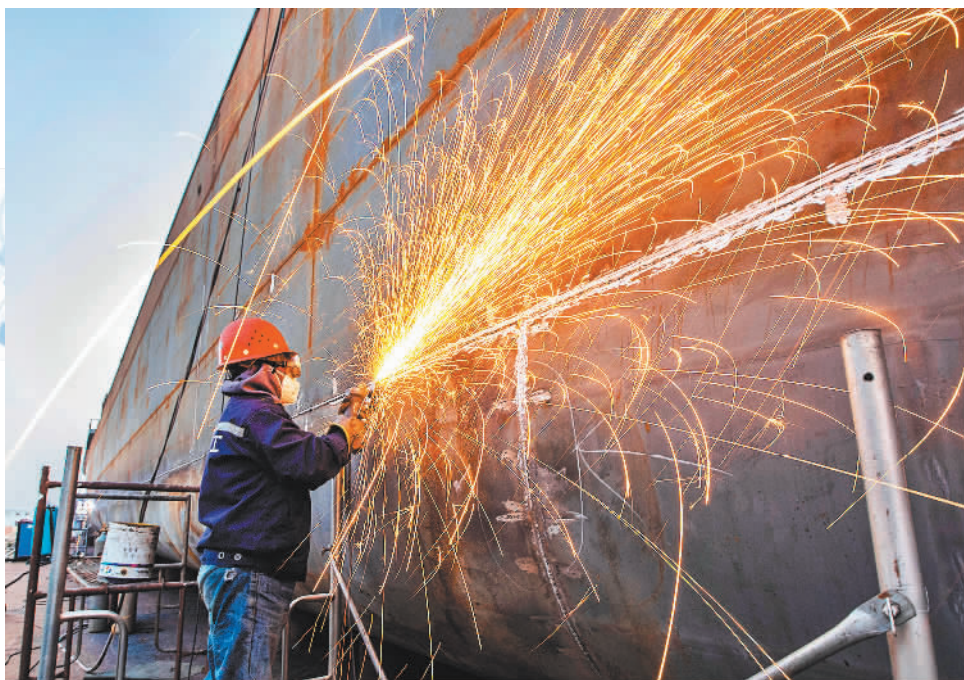
▲12月1日,江西省九江市都昌造船总厂,工人在赶制船舶订单。