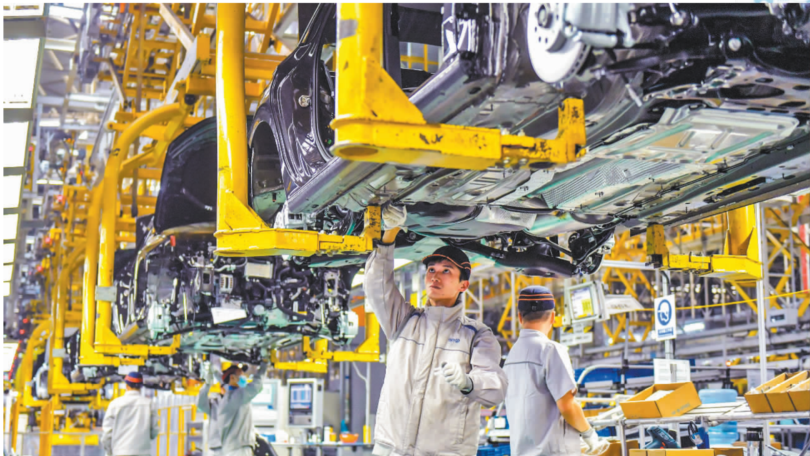
▲12月9日,位于四川省成都经济技术开发区的一汽-大众成都分公司,员工在组装车辆。该公司最快54秒即可产出下线一辆新车,最高日产量2000台。