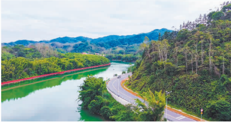
▲农行惠州博罗县支行 为环“南昆山—罗浮山”引领区建设 注入金融活水,助推“百千万工程” 落地见效

党的二十大对全面推进乡村振兴、促进区域协调发展作出重要部署。广东省为推动城乡区域协调发展、全面推进乡村振兴,迅速实施“百县千镇万村高质量发展工程”(以下简称“百千万工程”)重大战略。3年来,中国农业银行广东省分行(以下简称“农行广东分行”)把服务广东“百千万工程”作为全行头号工程,聚焦产业发展、城乡建设、底线民生持续加大金融供给,下沉金融力量、金融服务、金融产品,在南粤大地的田间地头、工厂车间、城市街区书写了百县繁华、千镇兴业、万户增收的生动故事,“农”情绘就了广东百县千镇万村新图景。