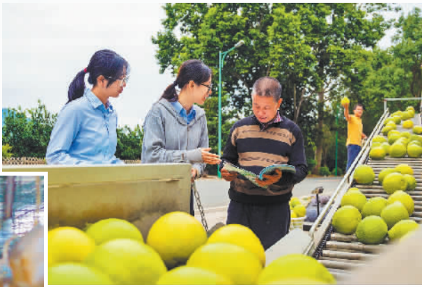
▲农行梅州分行员工逐户走访当地柚农,为柚子种植户介绍农行特色产品

速。农行梅州分行创新推出“金柚e贷”“农资e贷”等产品,构建起覆盖柚果“种植、加工、销售”的全链条金融服务体系,为梅州“百千万工程”注入源源不断的金融活水。截至目前,农行梅州分行共支持梅州金柚产业链农户、专业大户5702户,发放“惠农e贷”11.1亿元;累计向梅州金柚产业投放贷款16.9亿元,惠及278户农业龙头企业和小微企业。