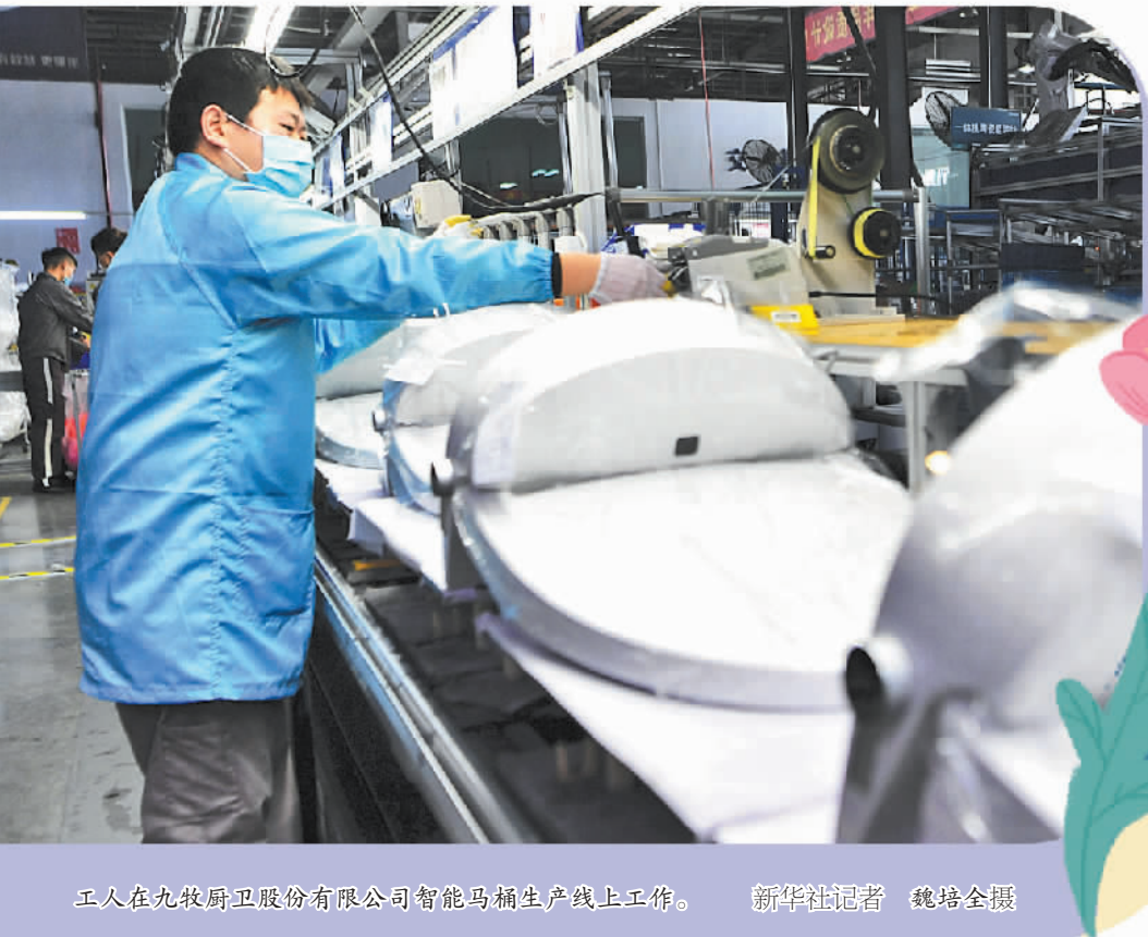
工人在九牧厨卫股份有限公司智能马桶生产线上工作。

无需弯腰，人体靠近即可自动翻盖翻圈；离座起身，马桶开始自动冲水……如今，智能家居概念深入人心，智能马桶开始走进千家万户，成为许多家庭卫生间的“标配”。 中国家用电器协会智能卫浴电器专业委员会发布的《中国智能卫浴电器产业发展研究报告(2025)》显示，我国已成为全球智能坐便器第一大生产国和消费国，2024年智能坐便器行业年产量1372万台，同比增长8.5%，行业总产量连续4年突破1000万台。