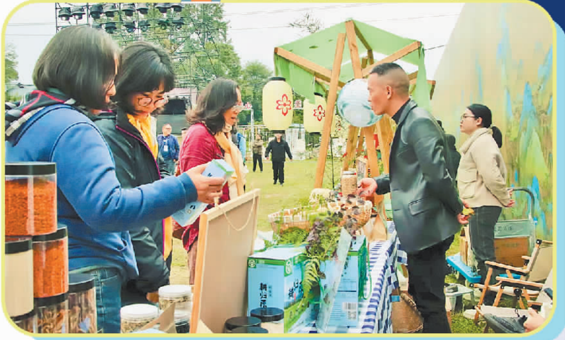
消费者在“诗乡杂货铺”购买特色产品。