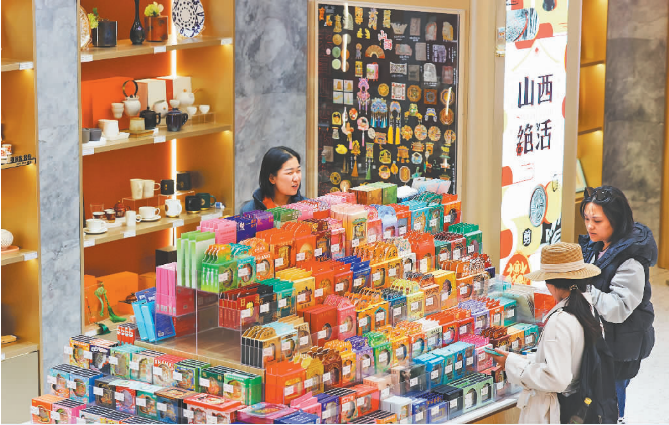
▲10月29日,游客在山西太原钟楼街晋礼城市会客厅文创店选购商品。这里有2000多种文创产品,一站式展示了山西各地文化特色。