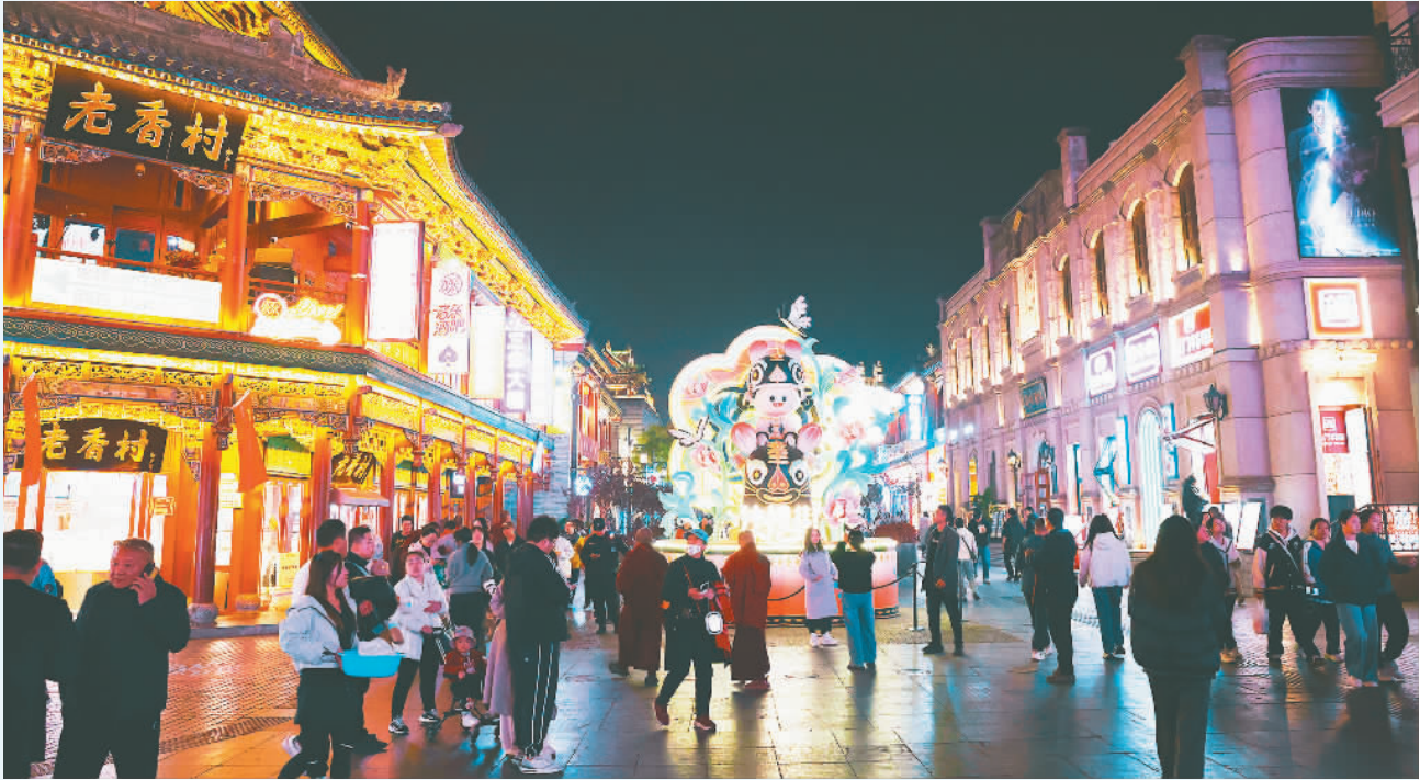
▼10月29日,入夜后的钟楼街灯火璀璨,丰富场景吸引市民来此散步休闲、购物娱乐。