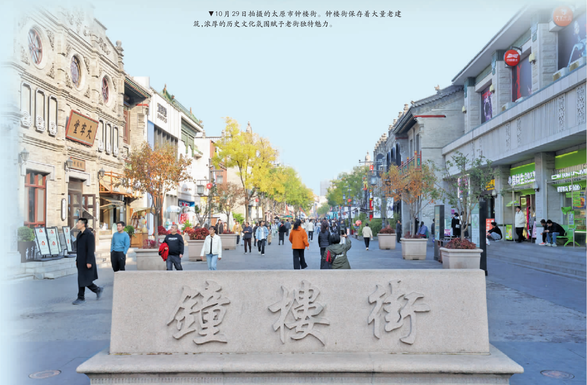
▼10月29日拍摄的太原市钟楼街。钟楼街保存着大量老建筑,浓厚的历史文化氛围赋予老街独特魅力。