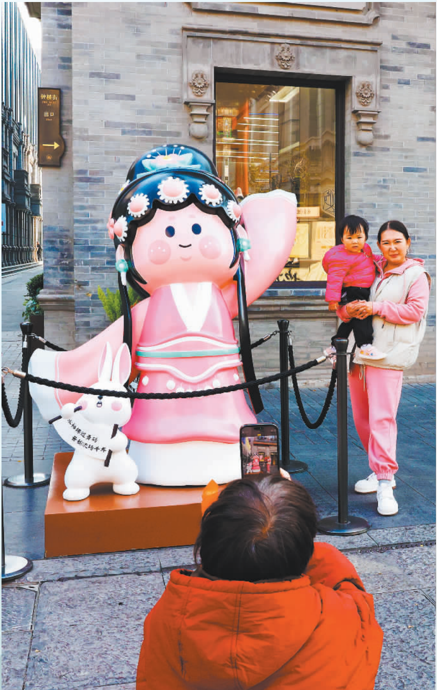
▲10月29日,游人在太原钟楼街上与吉祥物“钟宝儿”合影。

一条钟楼街,半部府城史。”作为山西省太原市地标性商业街,钟楼街的历史可追溯至宋代。这里是太原百余年来重要的商品集散中心,承载着城市的历史记忆与文化根脉,并在时代发展中不断焕新,成为太原文商旅融合发展的闪亮名片。 这条老街,也曾经历发展“阵痛”,建筑老化,设施陈旧,空间无序……2020年,钟楼街启动提升改造工程,改造过程中坚持保护与更新并重:对街上的老字号建筑“修旧如旧”,保留青砖灰瓦、雕梁画栋的传统风貌与街巷原有肌理;引入现代商业理念,通过“同步拆迁、同步建设、同步招商”的方式,完善基础设施与服务功能,培育发展新业态,既满足市民游客对传统风貌的体验需求,也适配现代多元化消费偏好。 如今的钟楼街,“旧”与“新”和谐共生:白天,老字号坚守传统工艺的同时优化产品与服务,非遗展演等文化活动丰富着消费体验;夜晚,古街被灯光装点得古朴雅致,游人往来不绝,老字号店铺的烟火气与新潮业态的活力相得益彰。日常4万至6万人次、节假日10万至12万人次的日均客流,印证着这条老街的吸引力。