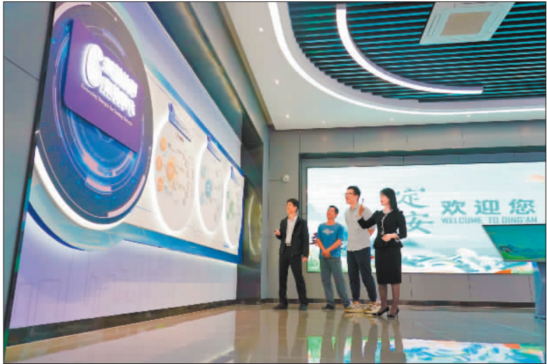
▼11月12日，定安塔岭工业园区展示厅，工作人员在介绍园区规划。该工业园聚焦生物医药、新型食品加工和绿色建筑三大产业，推动“制造”向“智造”跃升。

本版编辑 翟天雪 李秋昤 投稿网站 https://v.jingjiribao.cn/