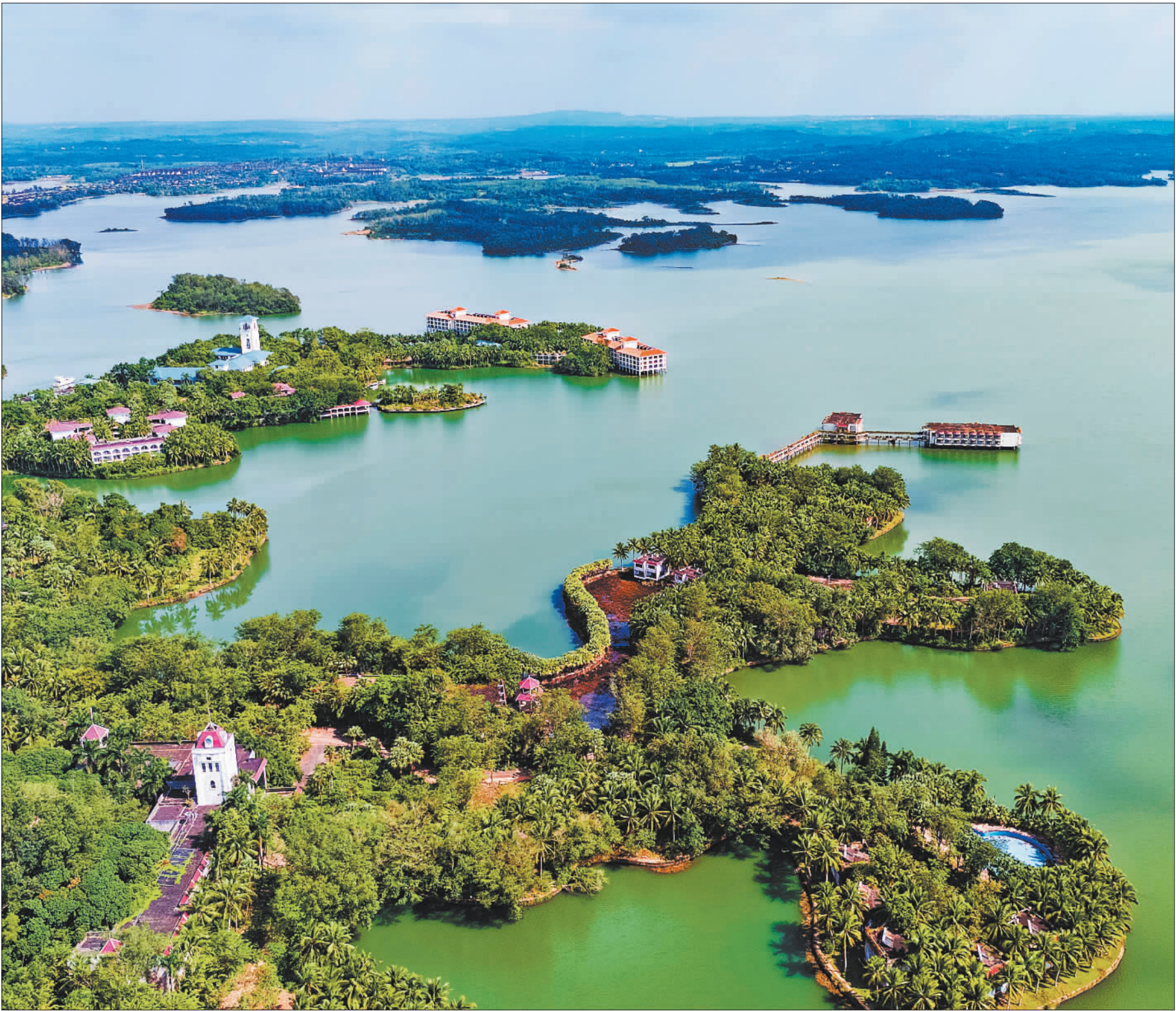
▲11月12日拍摄的海南省定安县南丽湖国家湿地公园。该湿地公园涵盖湖泊、湿地、鸟类栖息地和林地，有多种国家级或省级保护动植物资源。