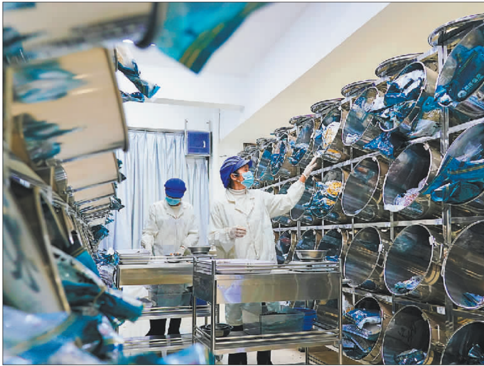
▼11月12日，定安县简氏盛泰药业有限公司员工在选配药材。