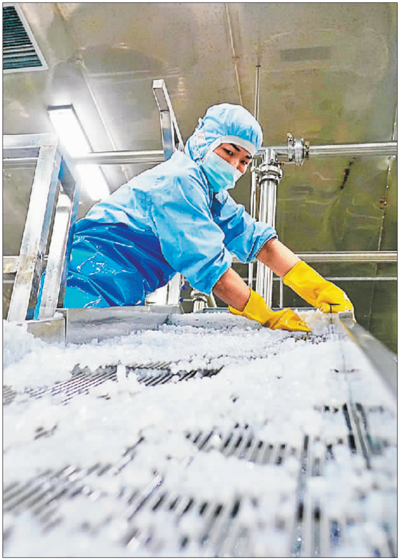
▲11月12日，定安县大好麦食品有限公司，员工在车间清洗设备。该公司生产的生椰椰汁、椰子水等饮料产品，受到消费者喜爱。