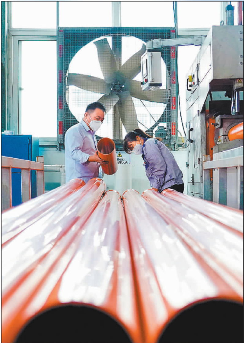
▲11月12日，工人在定安县海南联盟工厂生产车间检查管道。近年来，海南联盟通过数字化、智能化转型助推行业发展。