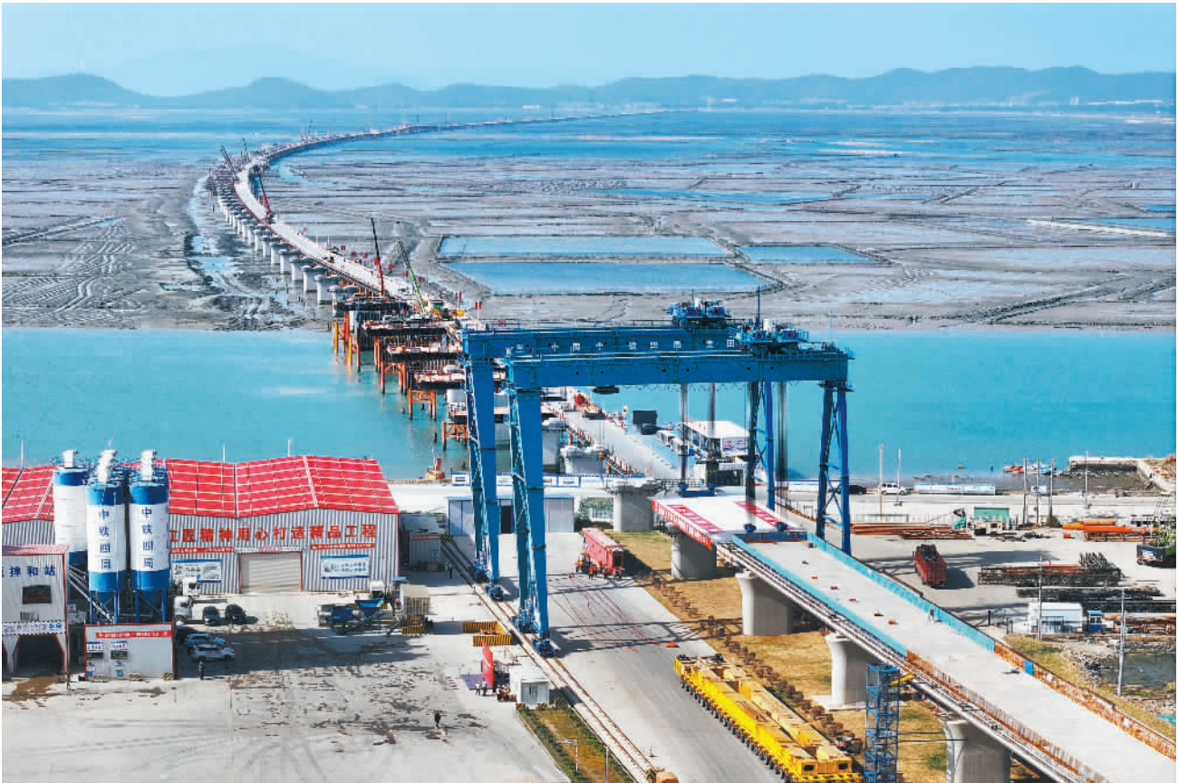
11月26日,北起福建漳州、南至广东汕头的漳汕高铁全线进入跨海大桥架梁施工阶段。该高铁是国家“八纵八横”高速铁路网沿海通道的重要组成部分,建成后将进一步完善区域路网结构,密切东南沿海地区交流联系。