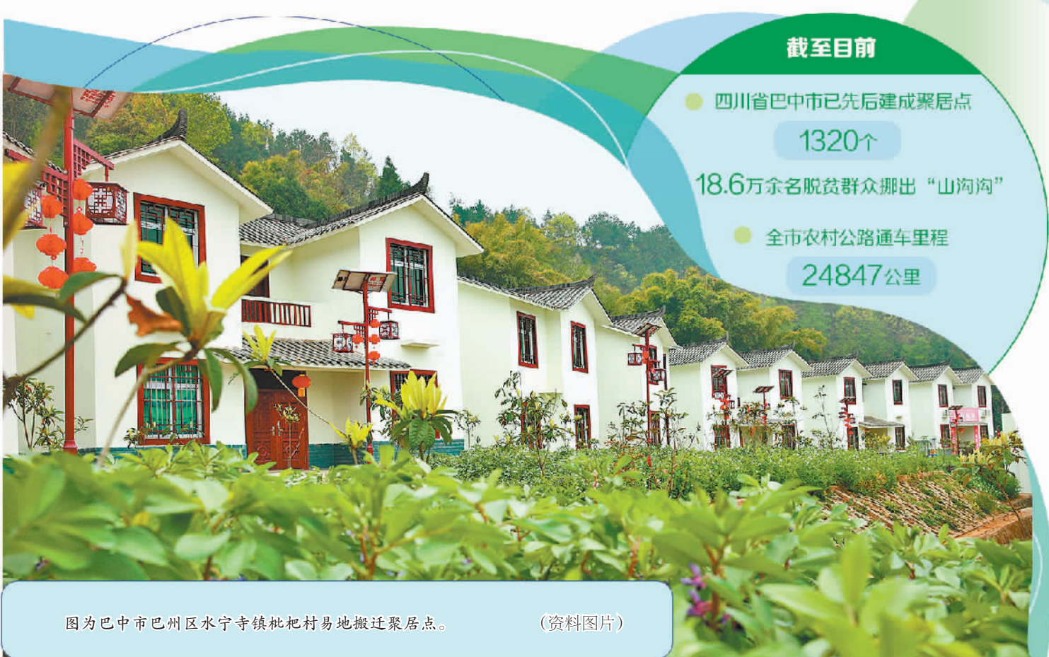
图为巴中市巴州区水宁寺镇枇杷村易地搬迁聚居点。（资料图片）

“我们构建‘初创有保障、成长有支撑、成熟促跃升’的全生命周期金融支撑网络，推动科技创新关键变量加速转化为产业升级核心增量，破解科技企业研发投入大、融资路径窄、资源匹配难等核心痛点，赋能江北高能级创新型城区建设。”江北区金融发展服务中心