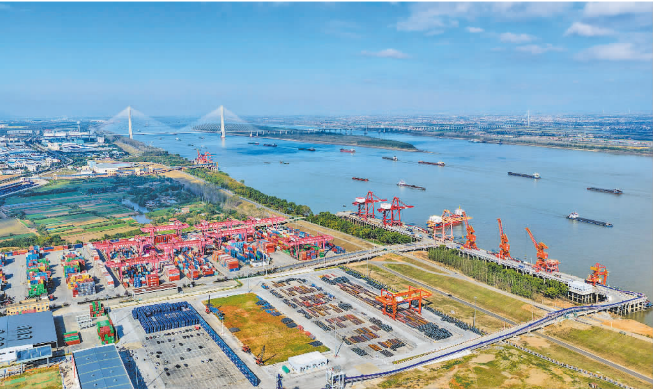
11月18日,上港集团江西九江港城西港区二期码头正式开港,多用途码头与滚装码头同步投入运营。码头的启用将进一步优化九江港功能结构,助力九江建设区域航运中心。

民间投资对稳定经济增长具有重要作用,金融保障则是激活这一作用的“催化剂”。此次《若干措施》的部署,回应了民间资本的现实诉求,为高质量发展注入了市场活力。随着新型金融工具精准落地,政策协同持续深化,民间资本也将发展新质生产力、推动产业升级中发挥更大作用。