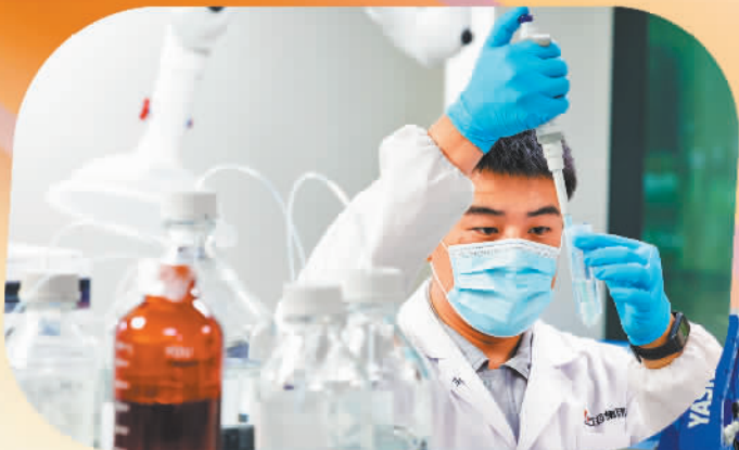
石药集团中央药物研究院 研发人员在进行液相实验