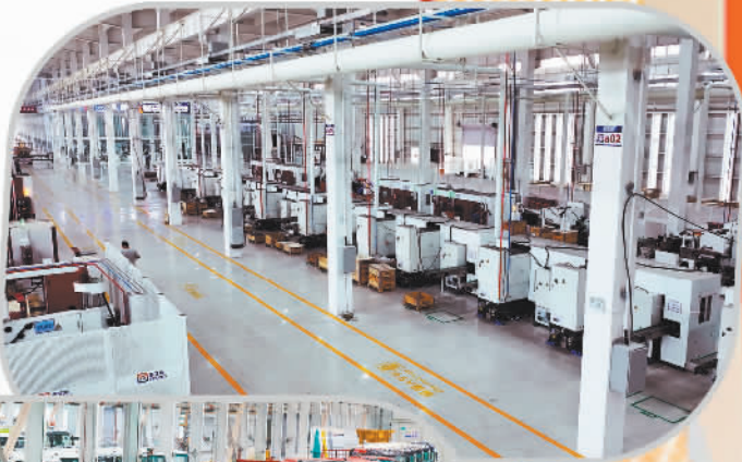
邢台市塞 艾斯(河北)工业 发展有限公司 智能化车间