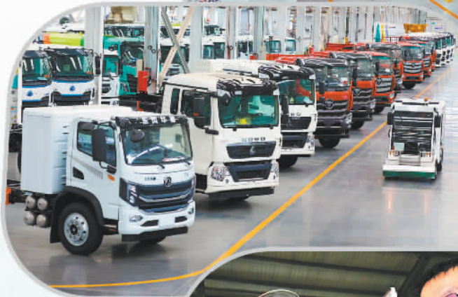
冀中装 备石煤机公 司环卫车组 装生产线