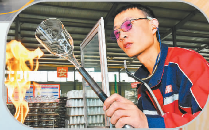
河间市工艺玻璃企业生产车间