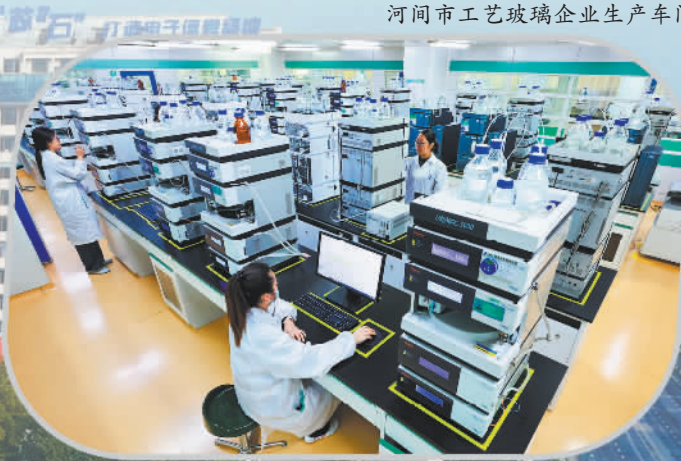
神威药业研发中心