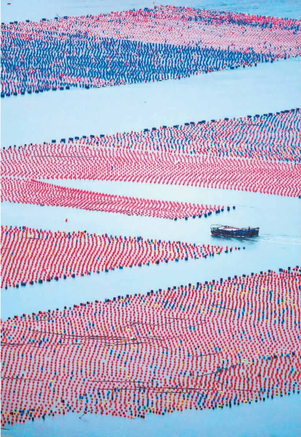
◀10月26日,养殖工人在福建省宁德市霞浦县三沙镇海域海洋牧场开展养殖作业。当地推进深远海养殖模式,助力海洋渔业升级。