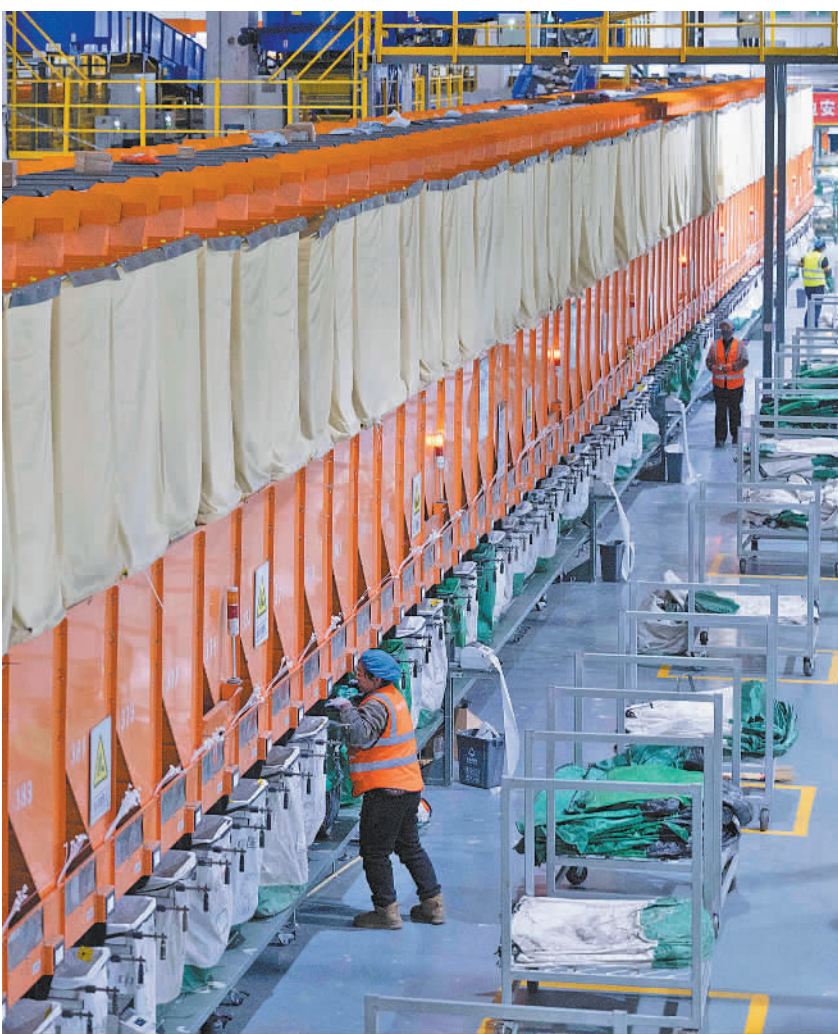
11月10日晚，工作人员在中国邮政集团有限公司黑龙江省哈尔滨邮区中心作业。“双11”网购高峰期到来，该中心灯火通明，一片繁忙。