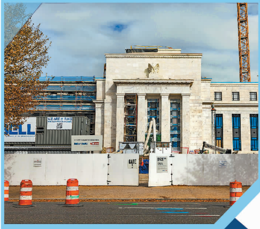
这是10月29日在美国首都华盛顿拍摄的美国联邦储备委员会大楼外景。

由于美国政府“停摆”,市场陷入了经济数据的真空期。在此期间,美国劳工统计局仅发布了一份延迟公布的美国9月消费者价格指数(CPI),令市场得以一窥美国经济现实处境的“冰山一角”。数据显示,9月份,剔除食品和能源的核心CPI环比上涨0.2%,同比上涨3.0%,为6月以来的