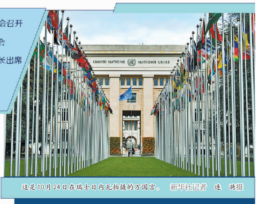
这是10月24日在瑞士日内瓦拍摄的万国宫。

大会全方位推动经济包容可持续发展。大会共包括40多场高级别会议和24个专家小组讨论,与会者围绕贸易、金融、生产力、大宗商品、全球贸易优惠制、金融和债务、人工智能、数字经济、投资、供应链和区域主义等热点议题,研讨了加强合作推动发展的切实途径。大会通过的《日内瓦共识》重申了“发展必须不让任何人掉队”的基本信念,并强调要在多个领域入手,建设更具包容性的全球经济。