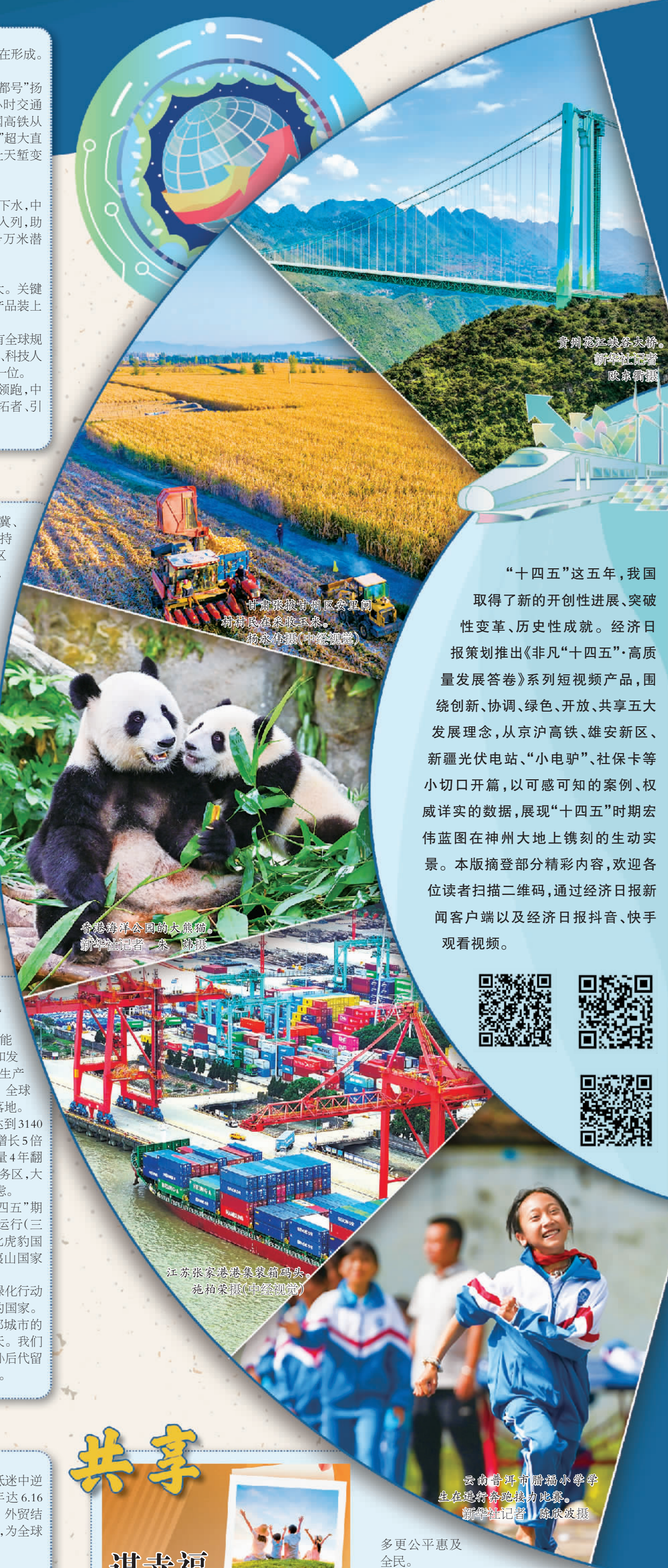
贵州范江峡谷大桥。