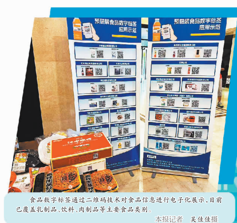
食品数字标签通过二维码技术对食品信息进行电子化展示,目前已覆盖乳制品、饮料、肉制品等主要食品类别。

行豁免或者减少,食品的名称、配料、营养成分等,无论是不是使用数字标签,都保留在食品实体标签上。此外,如果使用数字标签,生产者地址等信息的简化能节省出更多空间,可将字号放大展示消费者更为关注的信息;更多空间展示也能够进一步提升食品标签本身信息展示的清晰度及便利度。