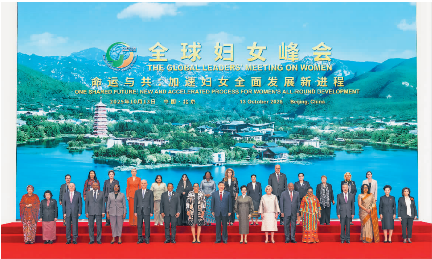
10月13日上午,国家主席习近平在北京国家会议中心出席全球妇女峰会开幕式并发表主旨讲话。