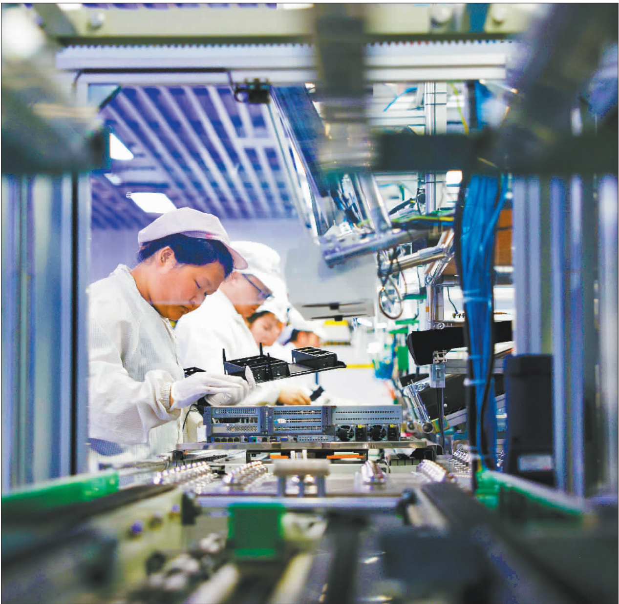
▲7月29日，贵州云上鲲鹏科技有限公司员工在服务器生产线上忙碌。作为贵安新区本土成长起来的高科技企业，云上鲲鹏凭借整机生产研发优势，聚合产业链上下游企业30多家、发展生态伙伴400多家。