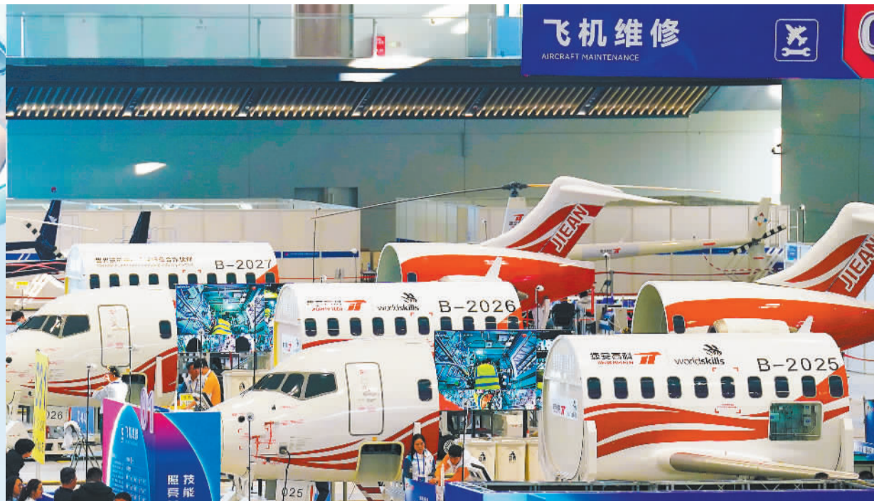
▲9月20日，选手在飞机维修项目比赛中。

如今，通过各级各类职业技能赛事活动，一大批技能人才脱颖而出，他们通过参加比赛改变了人生的轨迹，成就了出彩的人生，用技能照亮了前程。