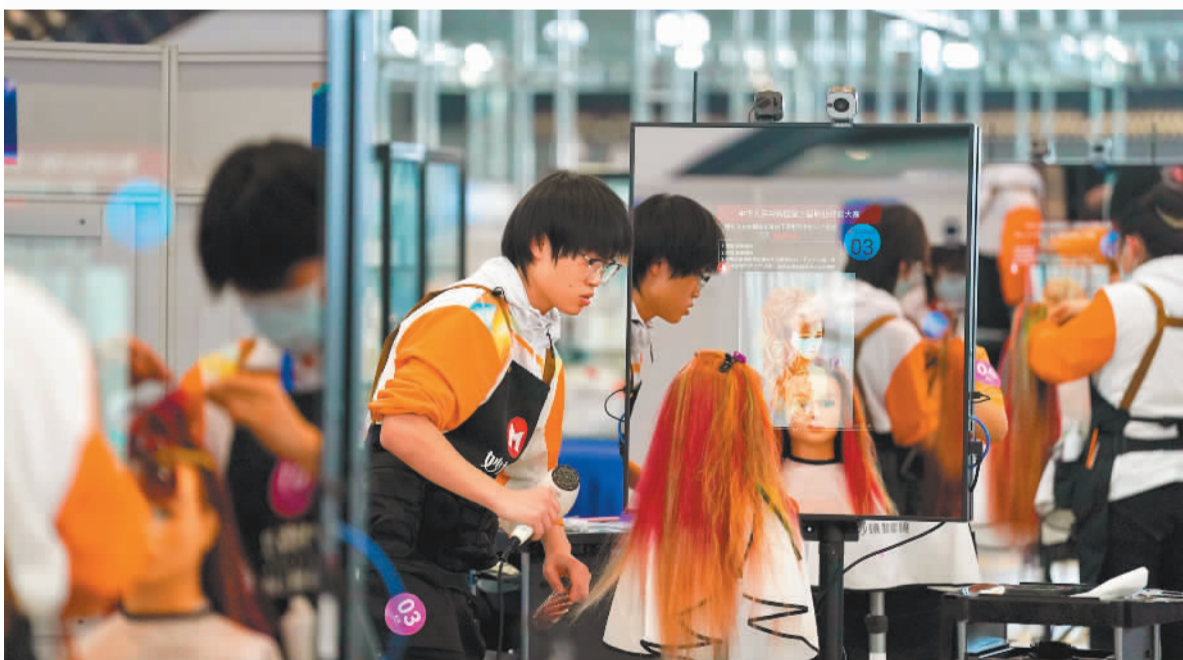
▲9月20日拍摄的中华人民共和国第三届职业技能大赛国家成果展现场。国家成果展系统展示我国职业技能发展的历程，全面呈现技能人才培养的丰硕成果、重大技术突破及其对经济社会发展的贡献。