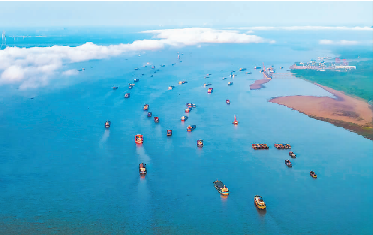
9月15日,安徽省池州市长江水域,装载生产、生活资料的各类船舶往返穿梭、有序航行。

文章强调,建设全国统一大市场,既是攻坚战,也是持久战,各地区各部门要从政治和全局高度抓好落实。中央和地方、地方和地方、政府和企业、企业和企业都要加强协调配合,形成推进合力。