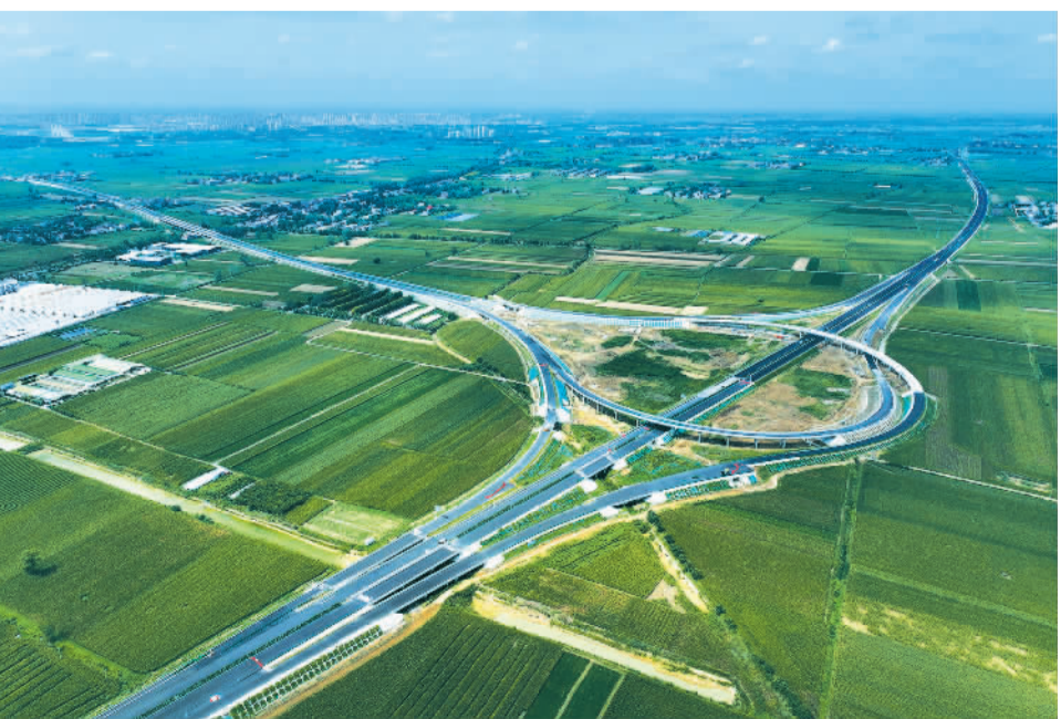
9月10日，安徽省蒙城县境内亳蒙高速二期板桥集枢纽建设现场，工人正在加紧施工。亳蒙高速计划于2025年12月建成，通车后将进一步完善安徽省高速公路网络布局，加强皖北地区与长三角地区的经济联系。

数据显示，今年1月至7月，孝感全市社会消费品零售总额达92.6亿元，同比增长6.2%；网络零售额突破80亿元，同比增长18%，增速高于湖北省10个百分点。