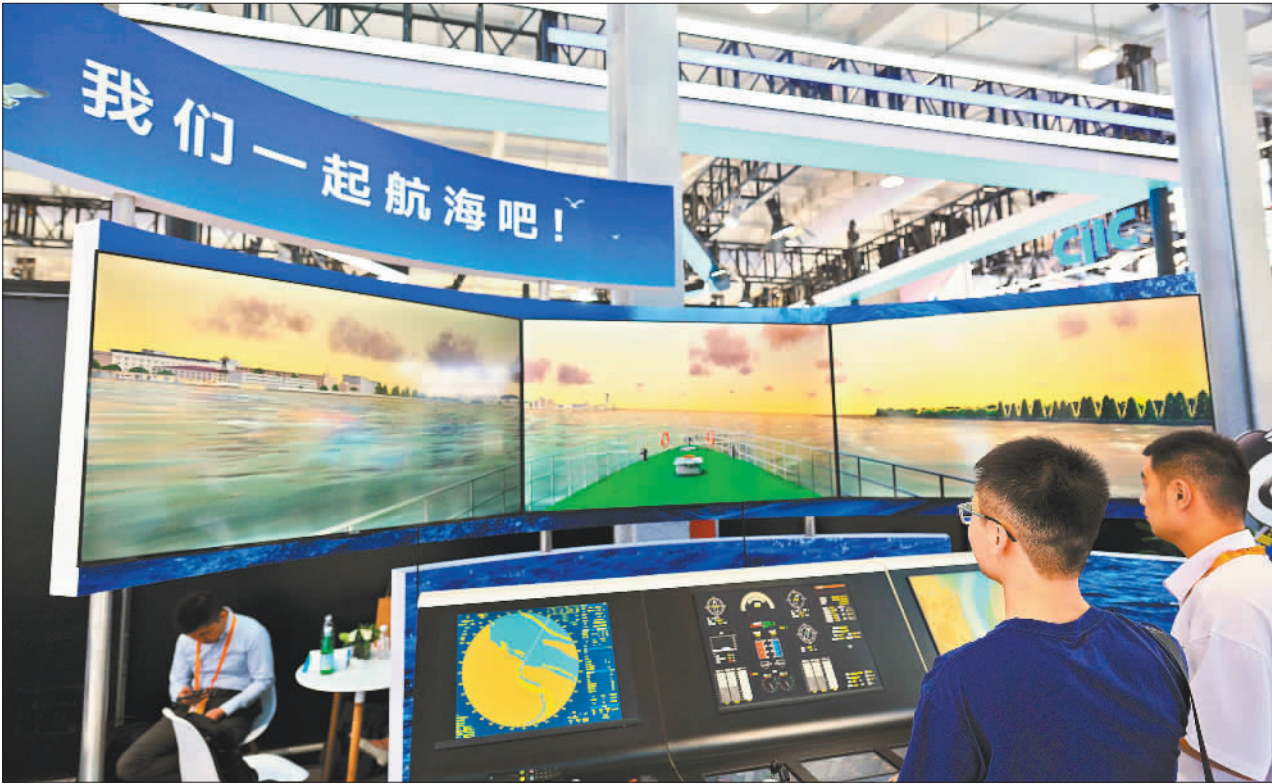
▲以“数智领航,服贸焕新”为主题的2025年中国国际服务贸易交易会9月10日在北京开幕,85个国家和国际组织设展办会,近2000家企业线下参展。图为9月11日,观众在服贸会现场体验航海模拟器。