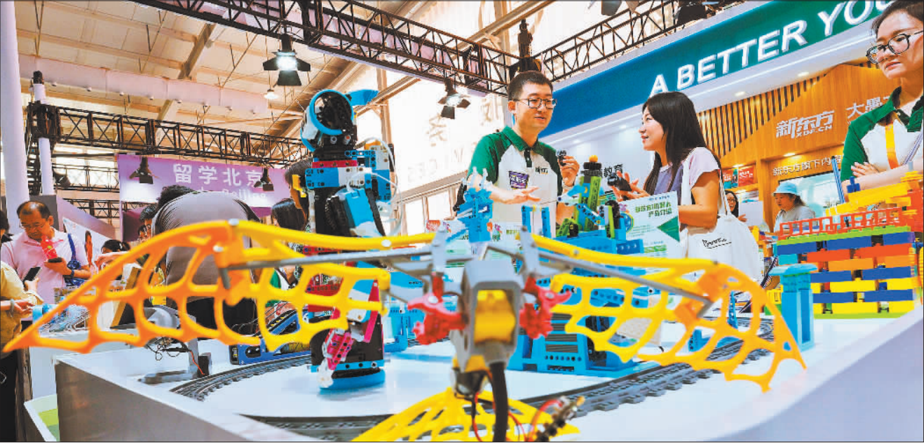
▼9月11日,观众在了解面向儿童的机器人教育课程。