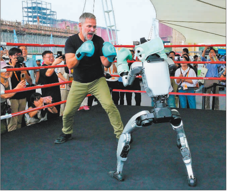
▲9月10日,观众和机器人进行拳击比赛。