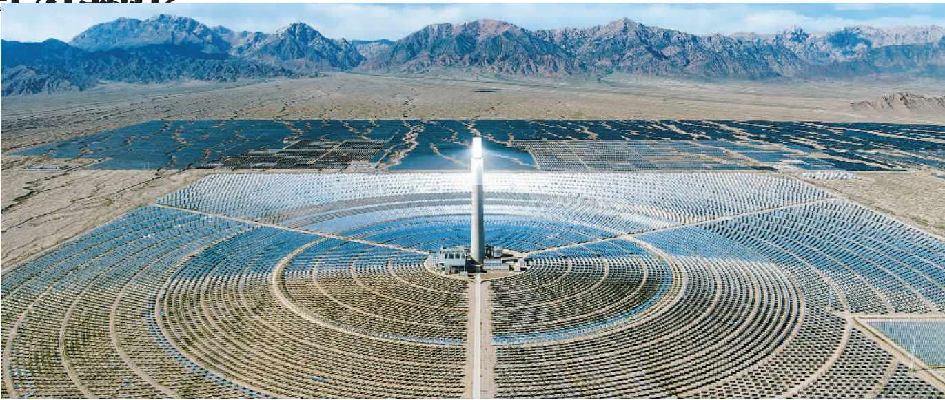
8月14日,青海省海西蒙古族藏族自治州德令哈市,青海中控50MW熔盐塔式光热电站高效运行。该光热电站是我国首批光热发电示范项目之一,也是全球首个年发电量超过年设计发电量的塔式熔盐储能光热电站,每年可节约标准煤约4.8万吨,减排二氧化碳气体约12.4万吨。

本报北京8月15日讯(记者齐慧)从国家铁路局获悉,7月份全国铁路客货运量稳步提升,运输安全持续稳定,有效满足了暑期旅客出行和货物保供需求。 客运方面,进入暑期以来,学生流、旅游流、探亲流等出行需求旺盛,铁路客流保持高位。7月份,全国铁路完成旅客发送量4.55亿人次,同比增长6.6%;完成旅客周转量1770.69亿人公里,同比增长5.7%。今年前7个月,全国铁路完成旅客发送量26.91亿人次,同比增长6.7%;完成旅客周转量9766.50亿人公里,同比增长3.3%。 货运方面,7月份,全国铁路完成货运发送量4.52亿吨,同比增长4.5%;完成货运周转量3042.17亿吨公里,同比增长6.5%。从分品类运输情况看,7月份,全国铁路发送煤炭2.35亿吨、集装箱0.93亿吨,同比分别增长3.3%、16.4%,重点物资运输保障有力,为国民经济平稳运行提供了有力支撑。 据悉,今年前7个月,全国铁路固定资产投资完成4330亿元,同比增长5.6%,铁路规划建设高效推进。