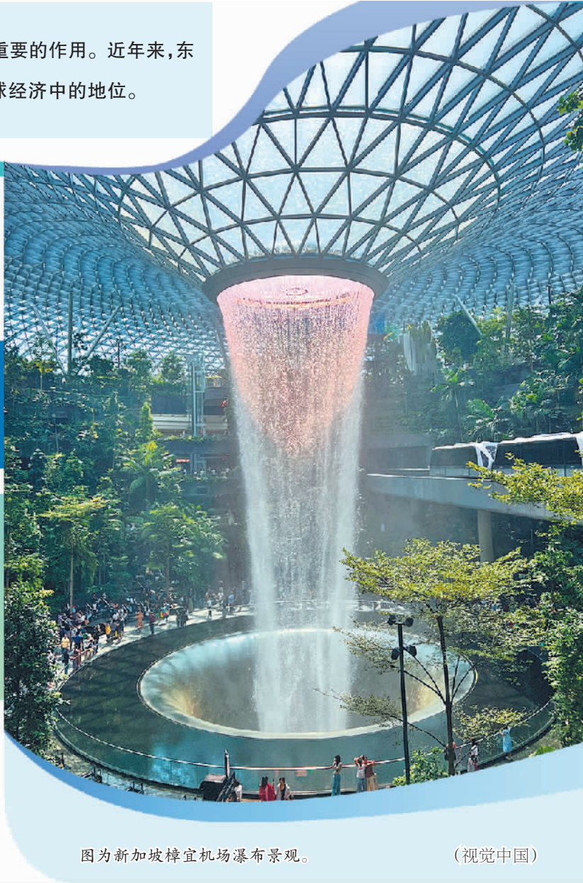
图为新加坡樟宜机场瀑布景观。

通过本届论坛,东盟各国可以进一步凝聚共识,加强合作,共同应对各种挑战,推动东盟一体化进程不断向前发展。同时,本届论坛也为新加坡等东盟国家提供了一个展示自身发展成果和优势的平台,有助于提升包括新加坡在内的东盟成员国在国际社会中的影响力和话语权。