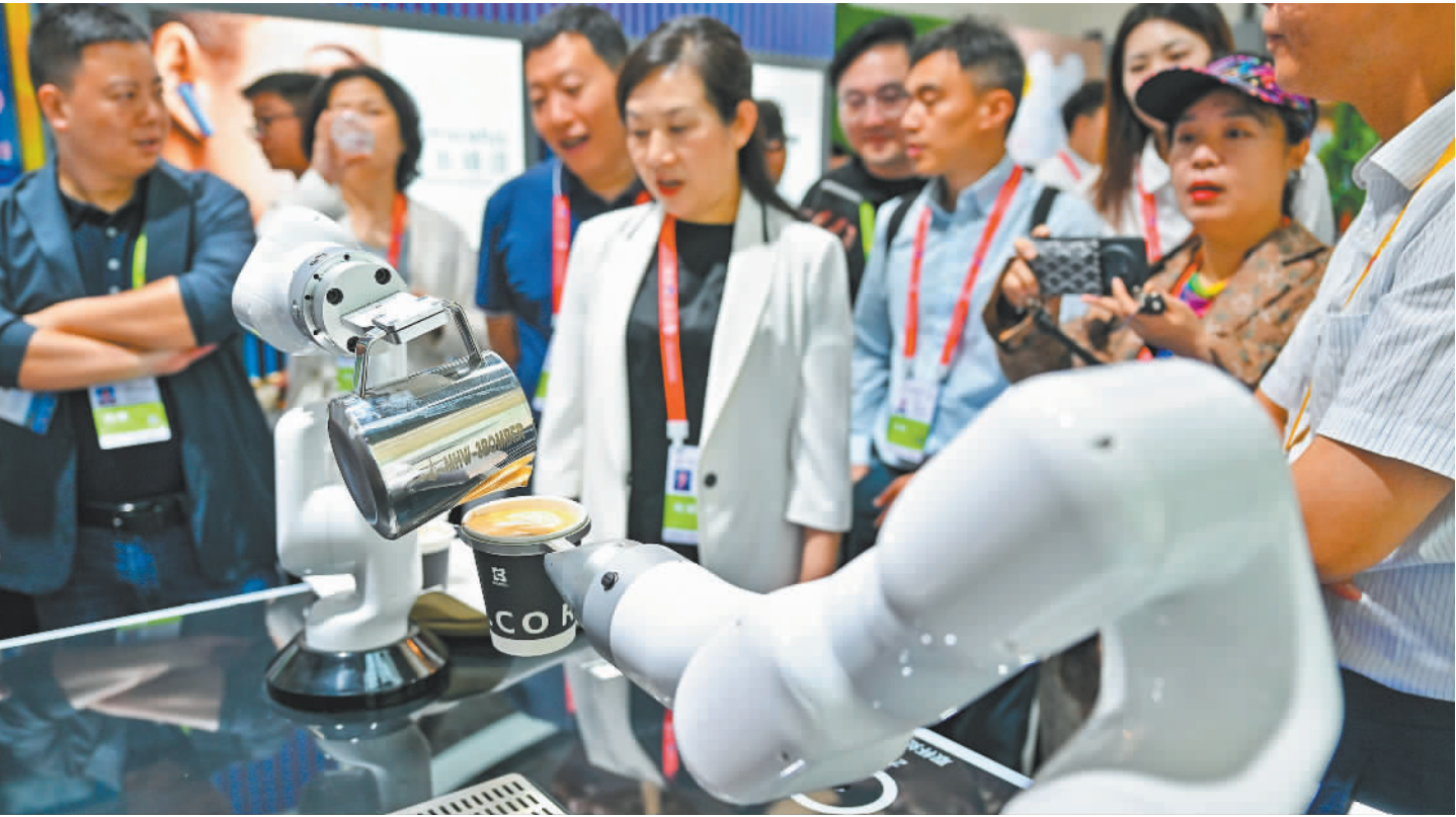
▲4月13日,观众在第五届消博会现场观看一款拉花咖啡机器人。随着新技术的发展应用,“人工智能+消费”催生出越来越多消费增长点。