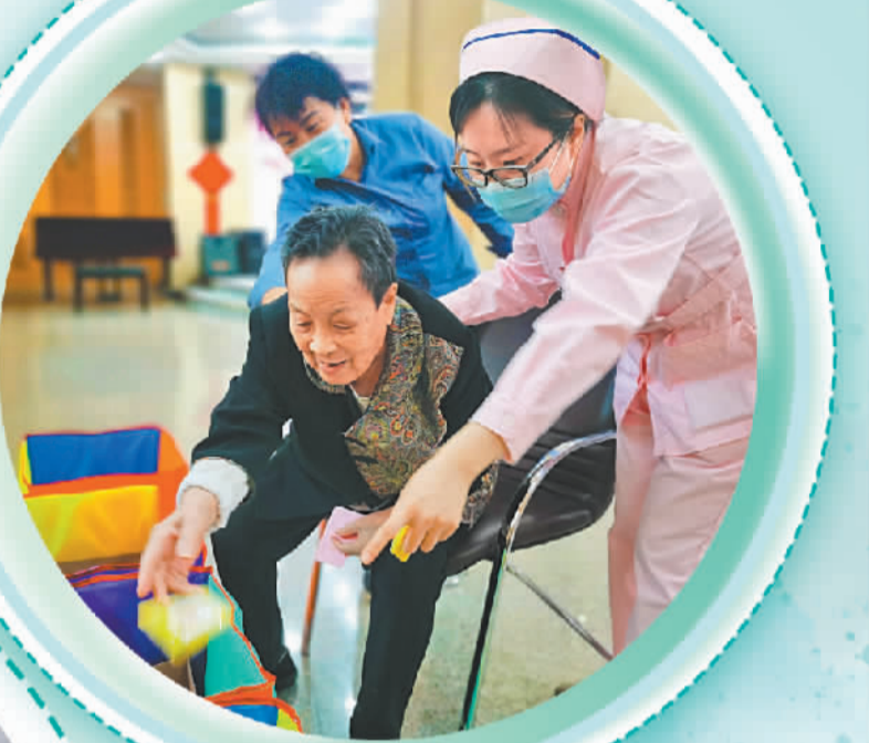
北京市第一社会福利院的养老服务员陪伴老人参加趣味运动会。(资料图片)