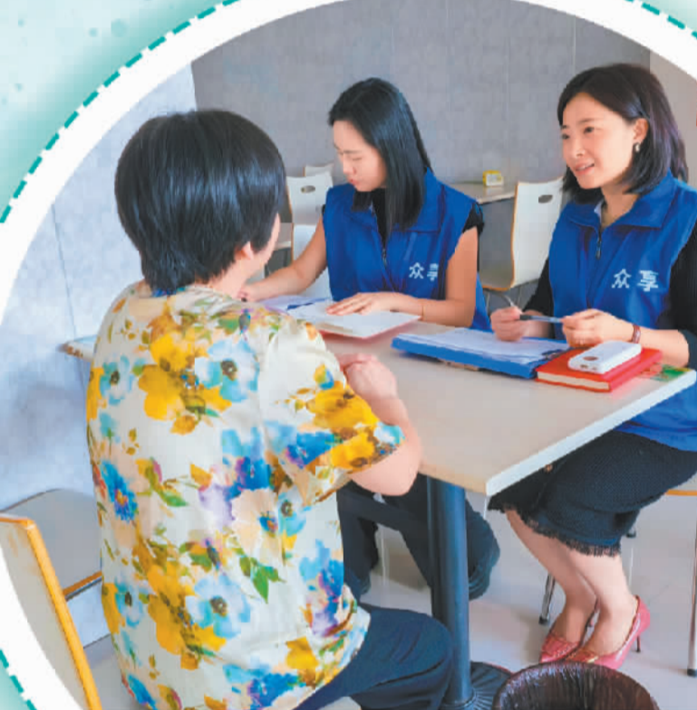
南京众享社会工作服务中心的老年人能力评估师正在为老人进行能力评估。