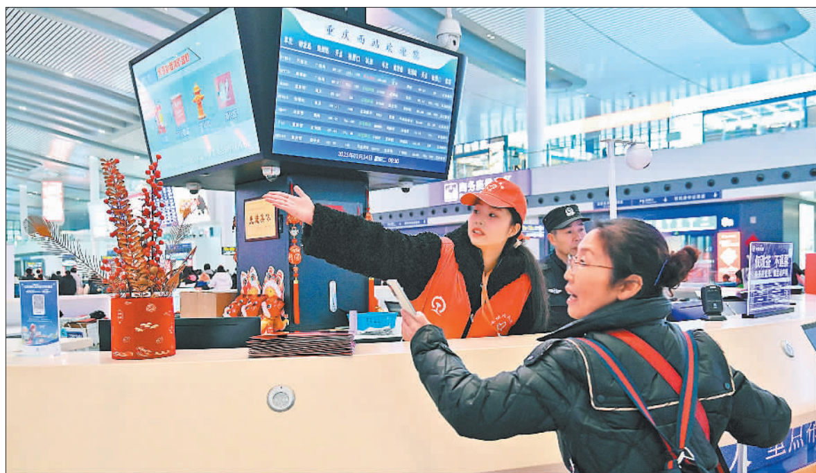
▲1月14日,重庆西站红岩服务站,大学生志愿者为乘客提供服务。