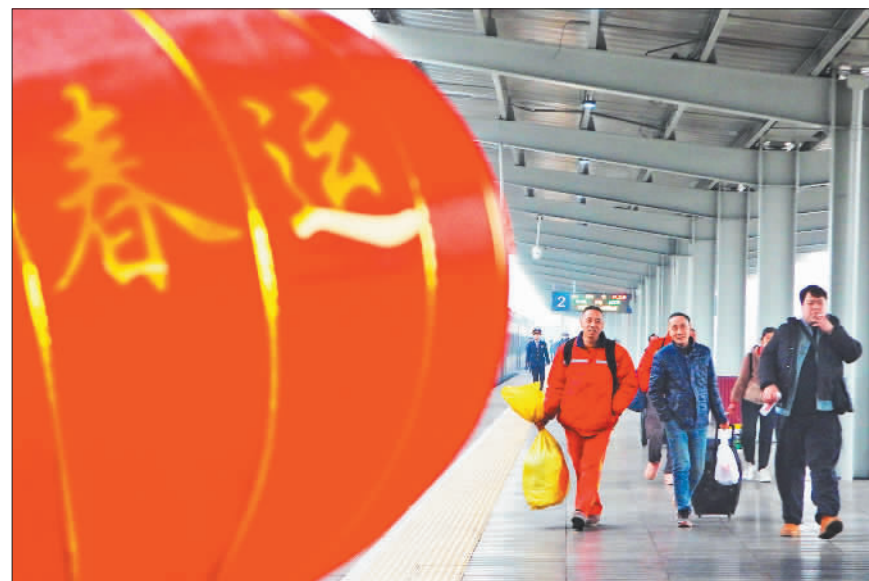
▲1月14日,四川省达州火车站,乘客准备乘车。