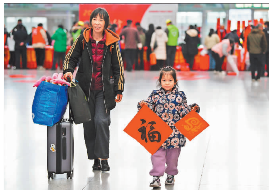
▶1月14日,江西南昌火车站候车室,旅客拿着“福”字踏上回家旅途。