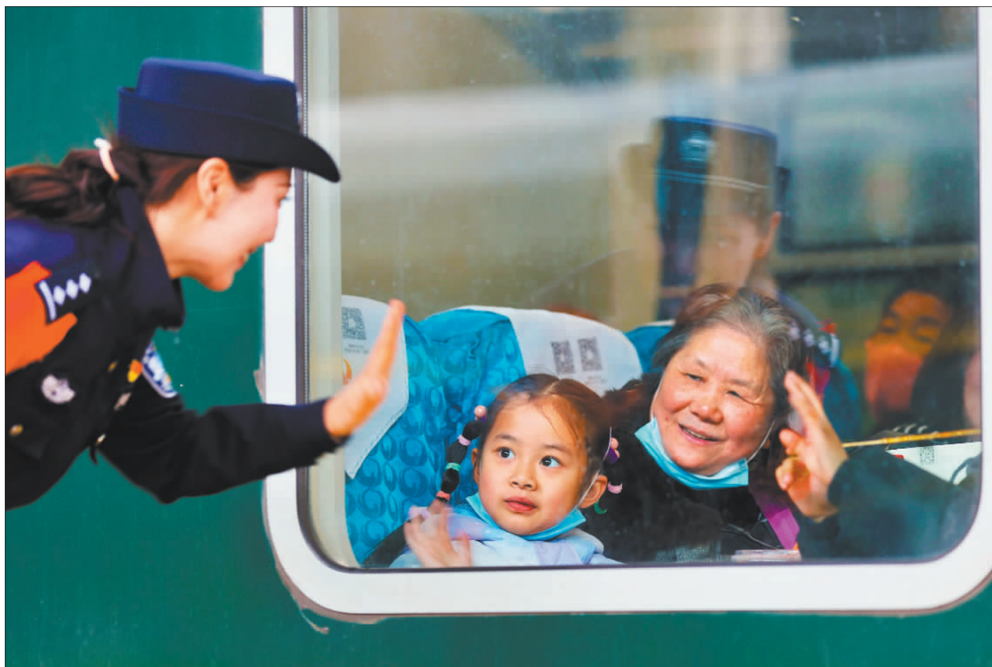
◀1月14日,旅客在湖北省武昌站乘车出行。