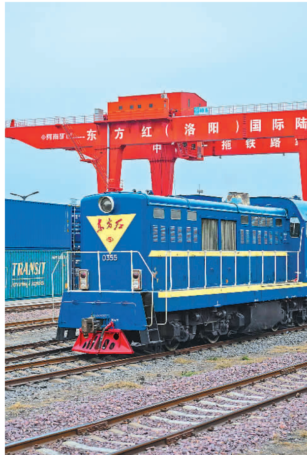
1月10日,2025年河南洛阳首趟“一带一路”班列自东方红(洛阳)国际陆港启程,驶向老挝。2024年,东方红(洛阳)国际陆港共发“一带一路”班列151列。

在消费品以旧换新方面,不仅会加大家装消费品换新的支持力度,还将实施手机等数码产品购新补贴,对个人消费者购买手机、平板、智能手表手环等三类数码产品给予补贴。国务院发展研究中心市场经济研究所原所长王微认为,应在一揽子增量政策工具中继续加大对消费的支持力度,重点加大以旧换新政策支持力度,扩大补贴覆盖产品类别,提升补贴申领便利度,在更多线下实体店和商业农村地区开展以旧换新。