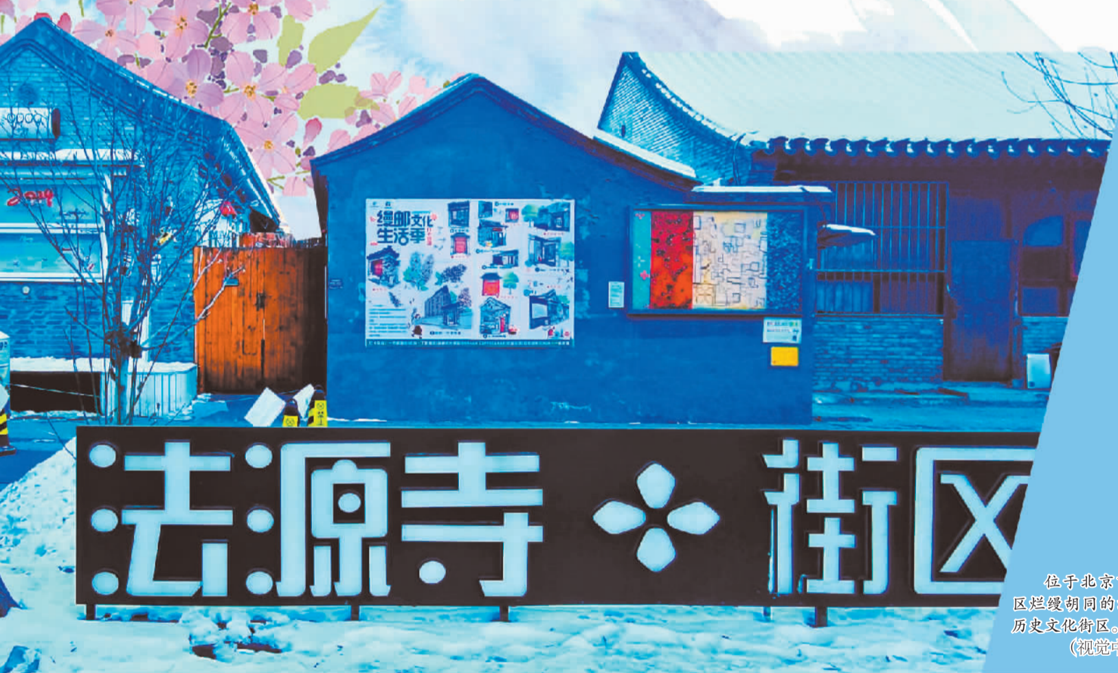
位于北京市西城区烂漫胡同的法源寺历史文化街区。