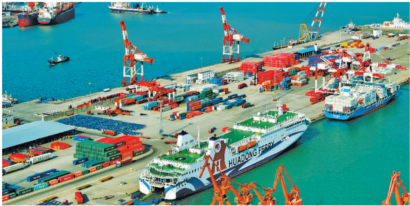
1月2日，多艘货轮在山东省荣成市石岛管理区石岛新港入港检测后卸载集装箱货物。近年来，荣成市抢抓国际海运业发展机遇，通过创造优质、高效的通关环境，促进跨境电商产业高质量发展。