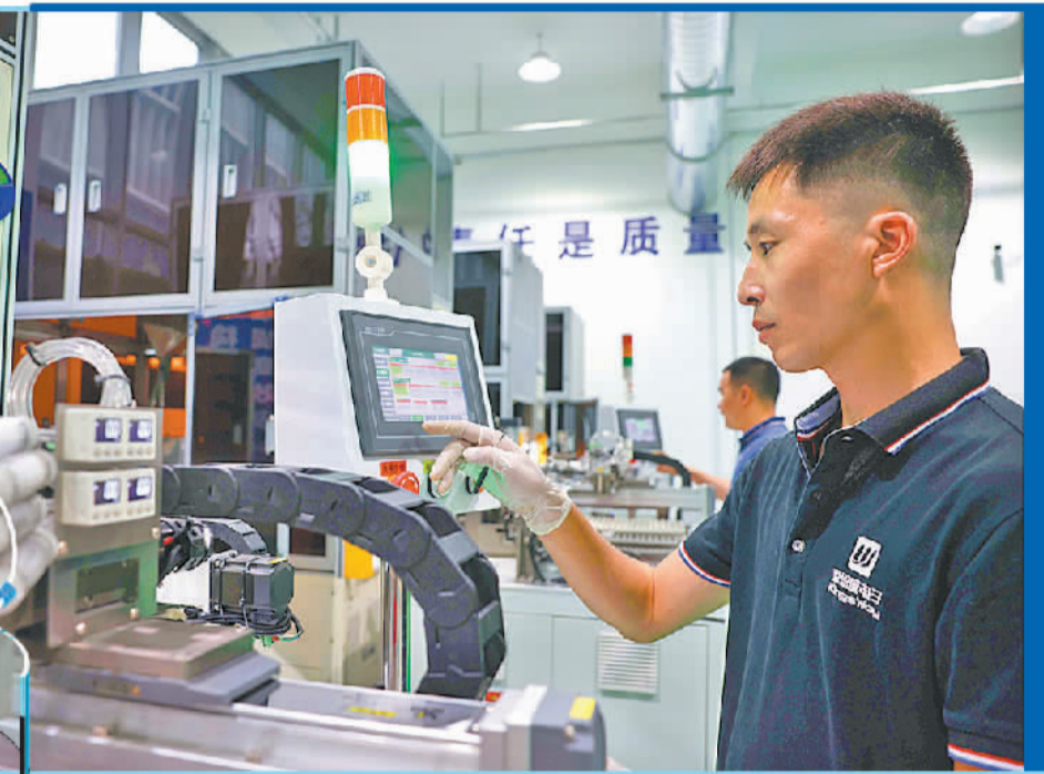
工人在合肥京思威电子科技有限公司自动化生产线上作业。

明产品经过了有关部门认证把关，客户用起来更放心。我们有两款创新产品进入目录，这项举措提振了我们民营企业的发展信心。”