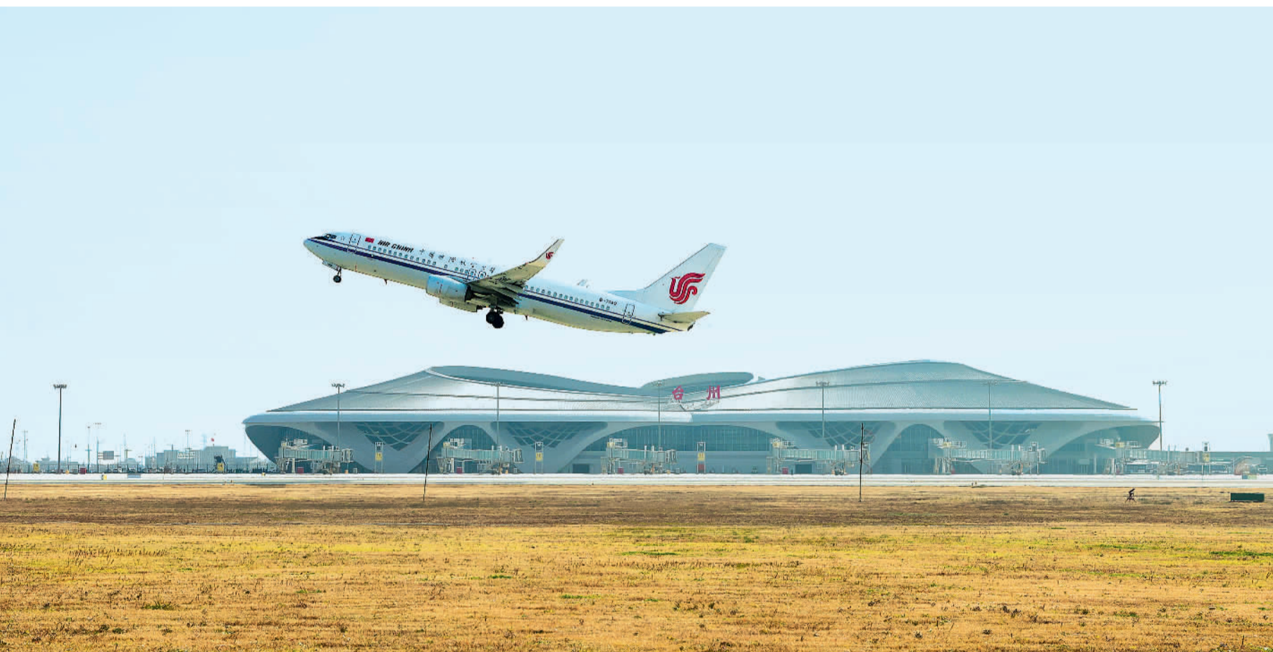
12月26日，浙江台州路桥机场改扩建工程建成投运后的首趟航班出港飞往北京。该工程是全国第一个大跨度双曲网壳钢结构工程，投运后将助力台州完善综合交通网络、扩大对外开放。

河北金融监管局近日发布公告，提示消费者防范不法贷款中介。临近年末，贷款市场上频现一些不法中介假冒银行名义，向消费者推送办理贷款信息，打着正规机构、无抵押、无担保、低息免费、洗白征信等极具诱惑性的旗号诱导消费者办理贷款，但其背后往往隐藏着高额收费、贷款骗局甚至洗钱诈骗等套路陷阱。对此，多家银行近期密集发声，明确表示未与任何中介机构或个人开展贷款业务合作。