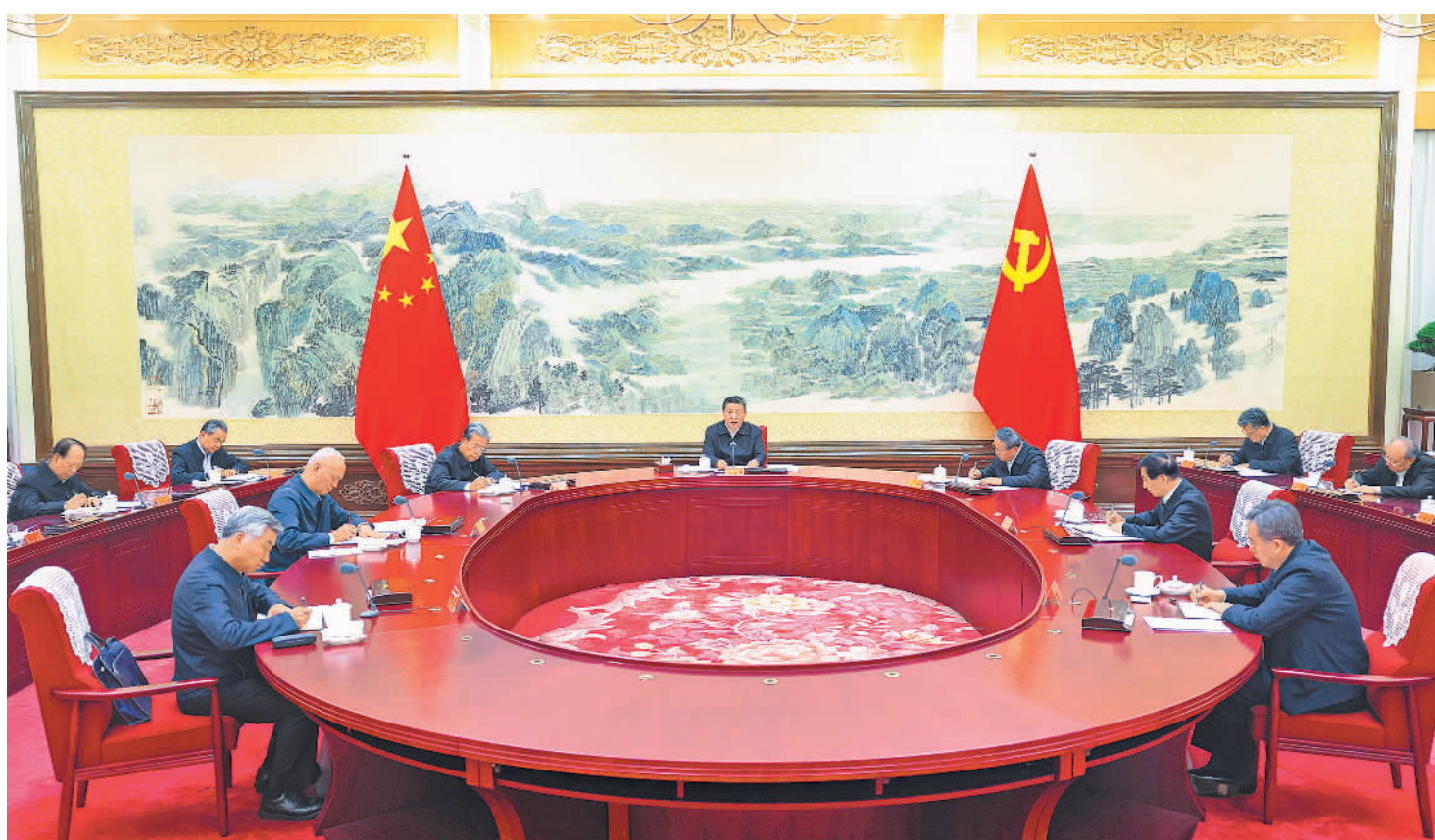
12月26日至27日，中共中央政治局召开民主生活会，中共中央总书记习近平主持会议并发表重要讲话。