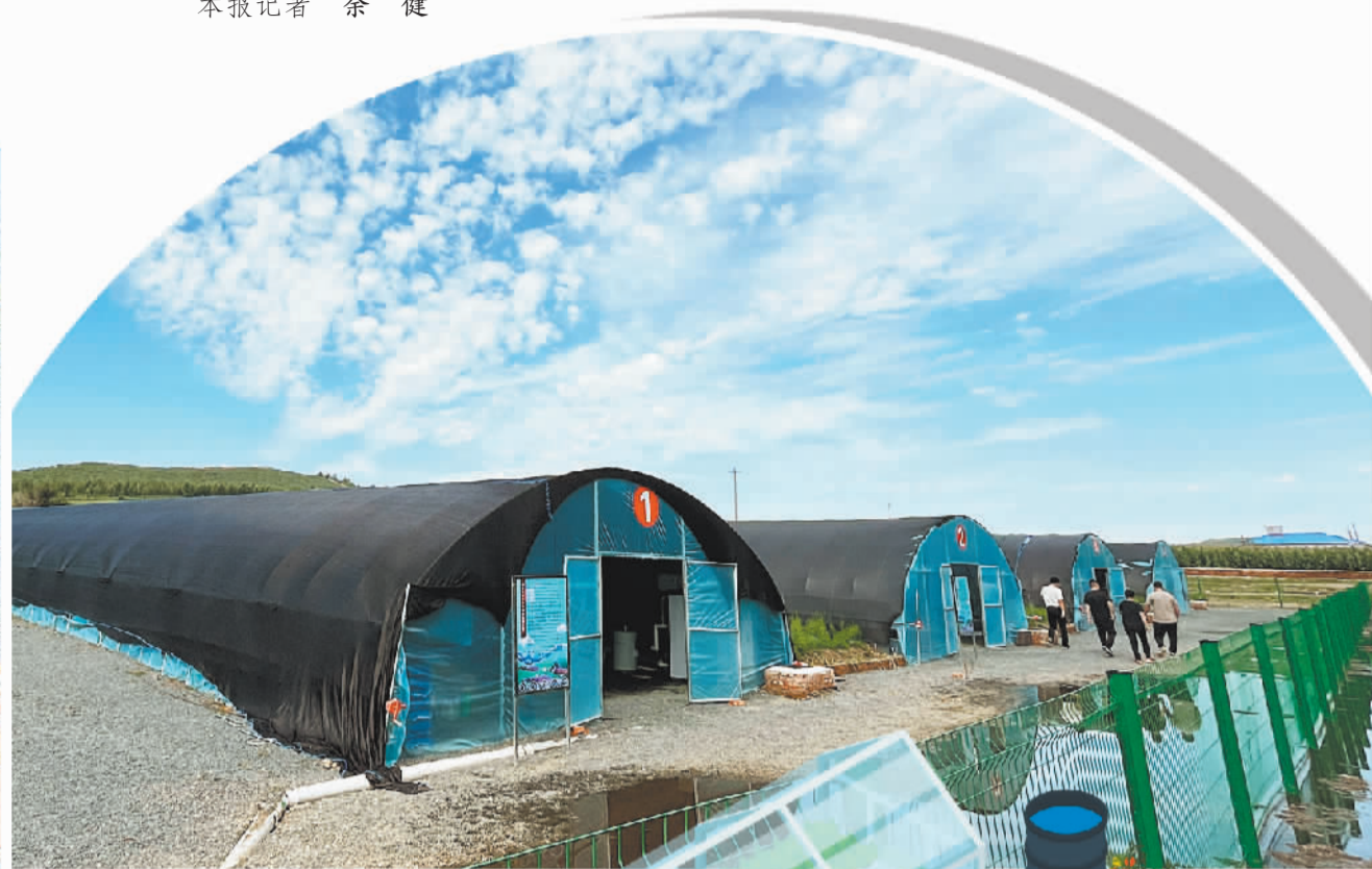
上图 内蒙古自治区兴安盟科尔沁右翼前旗巴日嘎斯台乡水库村,村集体鼓励村民在院子里建大棚养冷水鱼。