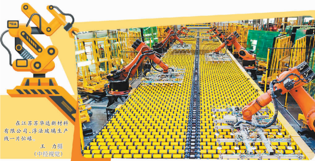
在江苏苏华新材料股份有限公司，浮法玻璃生产线一片忙碌。