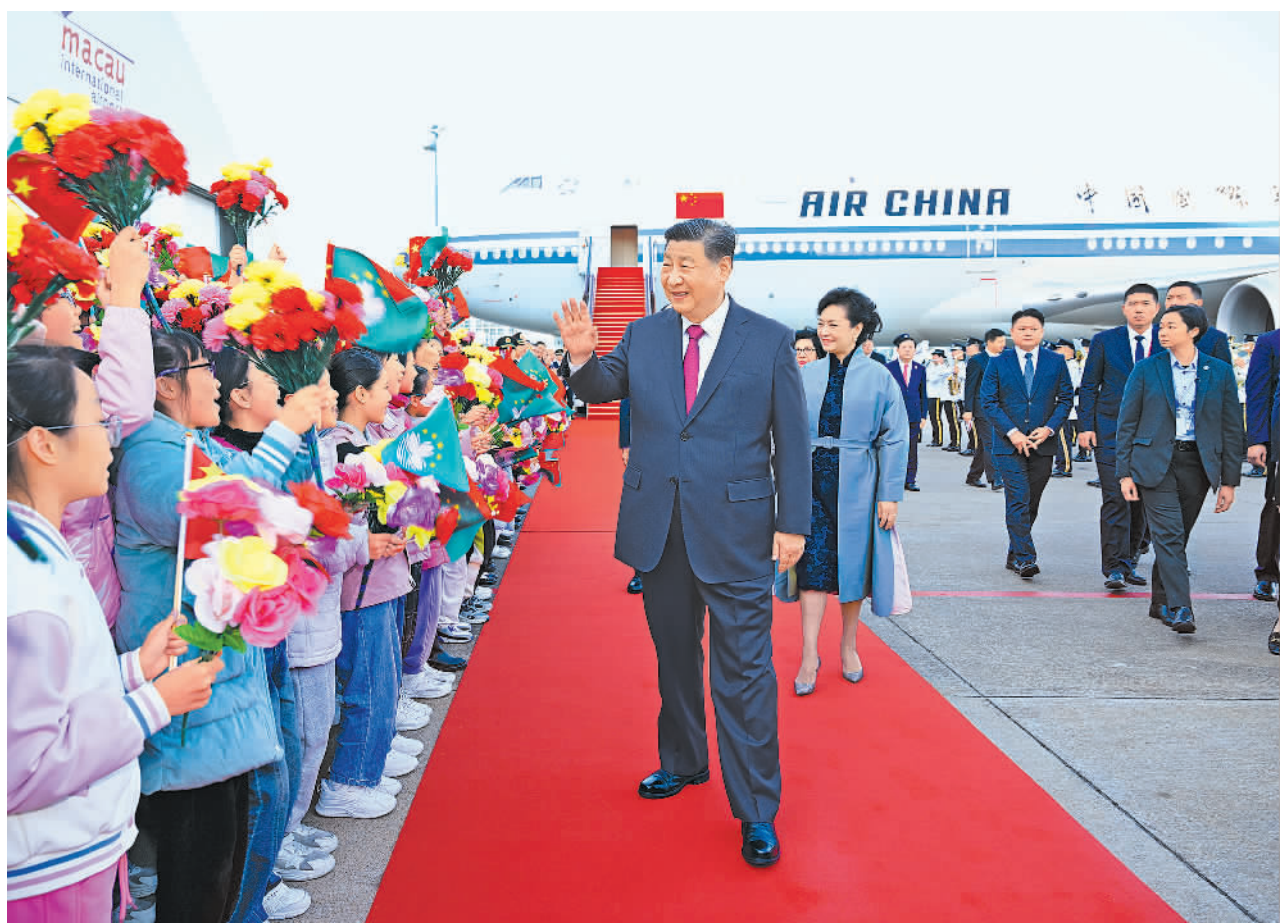
12月18日下午，中共中央总书记、国家主席、中央军委主席习近平乘专机抵达澳门，出席将于20日举行的庆祝澳门回归祖国25周年大会暨澳门特别行政区第六届政府就职典礼并视察澳门。这是习近平和夫人彭丽媛向欢迎人群致意。