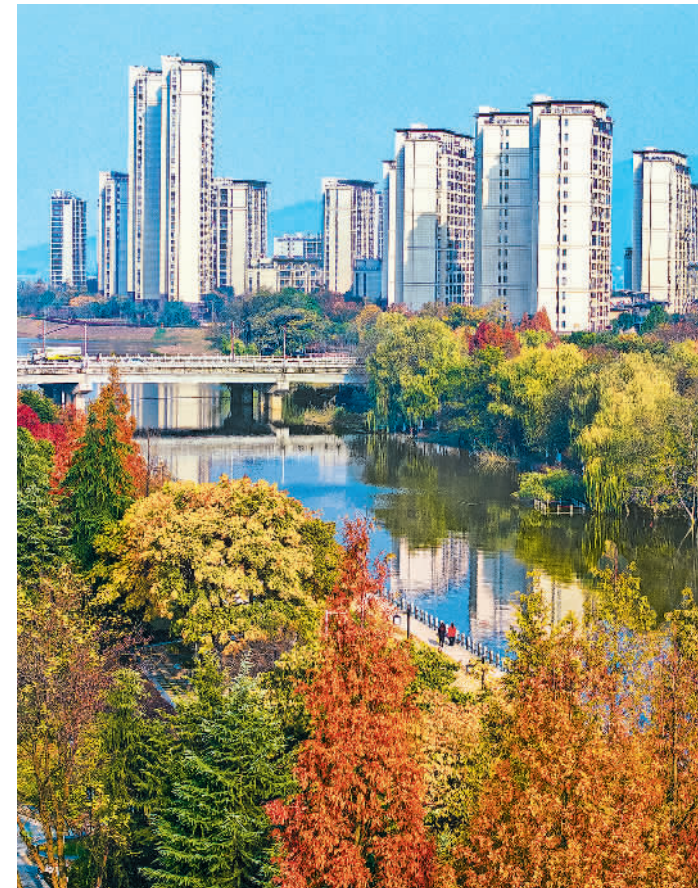
12月6日,安徽省芜湖市繁昌区,市民在风景优美的峨溪河畔休闲漫步。近年来,当地全面落实河长制工作,打造幸福河湖,优化峨溪河生态环境,提升群众幸福满意度。

同时,各地人力资源服务机构充分发挥匹配供需的作用,年均帮助3亿人次劳动者就业、择业和流动,高效促进市场化社会化就业;年均5000多万家次用人单位提供人员招聘和管理服务,其中40%是制造业企业,支撑和壮大实体经济的作用不断增强。