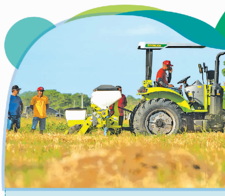
在巴西阿波迪，一款中国生产的农机正在田间示范作业。

世贸组织通过支持食品的安全贸易，帮助粮食生产者和贸易者达到有关规范和标准，进而确保小规模生产者也能够丰富其产出并且准入外国市场。中国、欧盟以及世贸组织其他成员已经接受了有关支持小型农场主的政策，这也有利于保障农村民生和粮食安全。