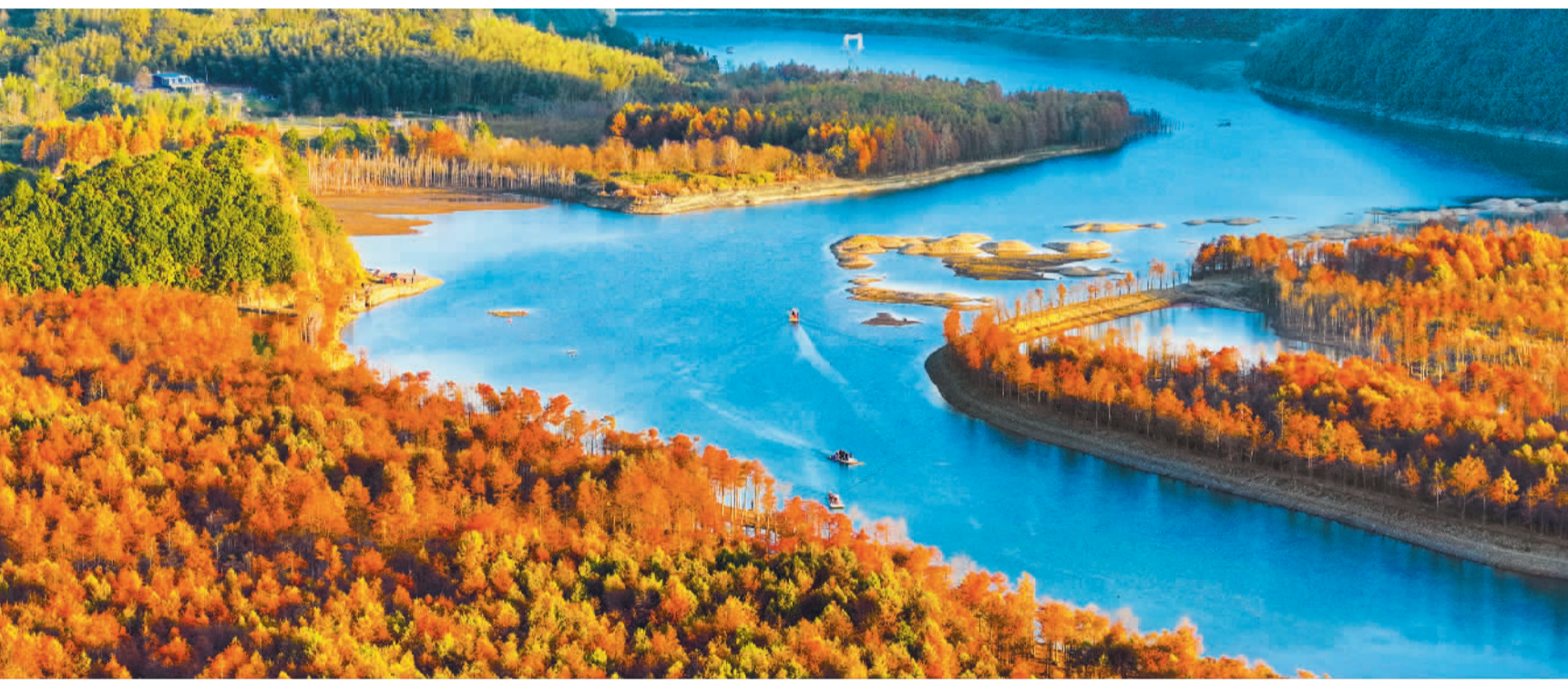
11月27日,安徽省宁国市落羽杉湿地公园内,碧水与红杉构成一幅美丽的冬日生态画卷。近年来,当地贯彻绿色发展理念,依托山清水秀的自然环境发展乡村旅游,助推乡村振兴。

数据显示,今年前10月,国外在华发明专利授权9.2万件,同比增长5.3%;商标注册12.1万件,同比增长13.1%。“这些数据充分体现了外资企业对中国知识产权保护工作的认可。”郭雯说,未来,将进一步提高知识产权保护水平,完善与外资企业的沟通机制,把各项工作做得更加扎实有效,更有针对性,营造更加公平、透明、可预期的营商环境,为外资企业深耕中国市场持续注入信心。