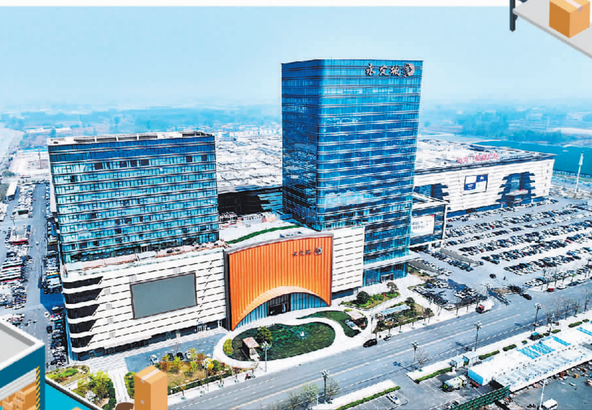
位于廊坊的永定城·京津冀固安国际商贸城。

市机器人产业高质量发展规划》。今年上半年，廊坊无人配送车、无人机等22家高智能物流装备制造相关企业实现营收2.05亿元。今年4月以来，廊坊累计投入无人驾驶快递车15辆，单件快递配送成本降低0.7元，仅为0.15元。