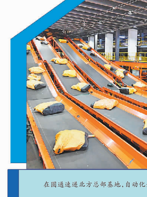
在圆通速递北方总部基地，自动化分拣设备有序运行。

不仅要吸引企业前来，更要助力企业提升市场竞争力。廊坊在科技创新上下功夫，全力打造以机器人应用为重点的智慧物流系统，高标准编制《廊坊