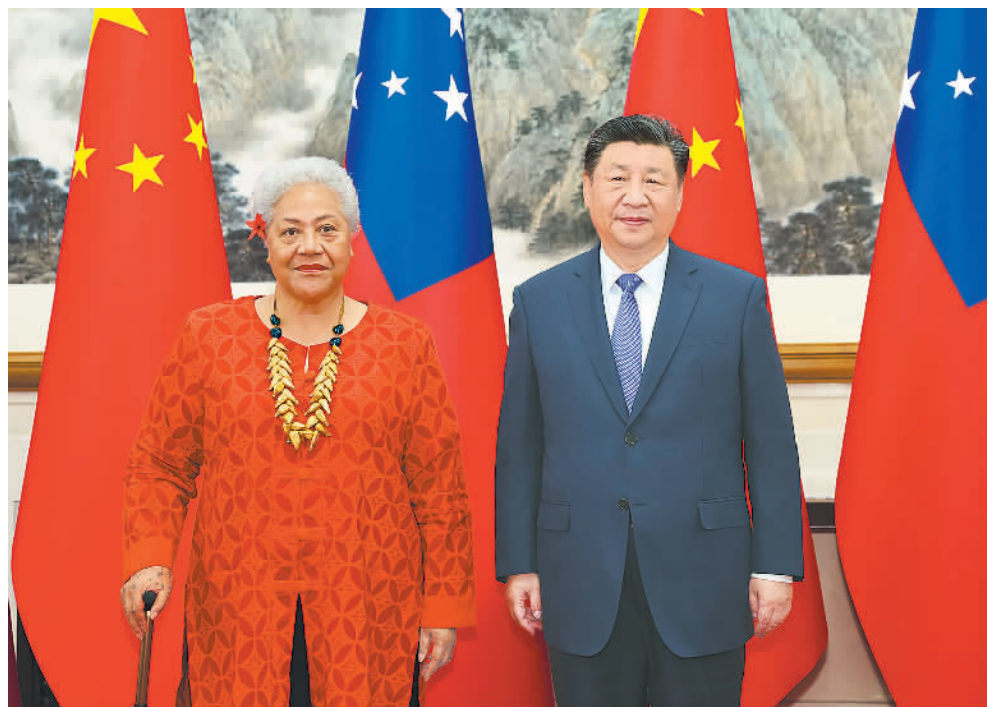
11月26日下午,国家主席习近平在北京钓鱼台国宾馆会见来华进行正式访问的萨摩亚总理菲娅梅。