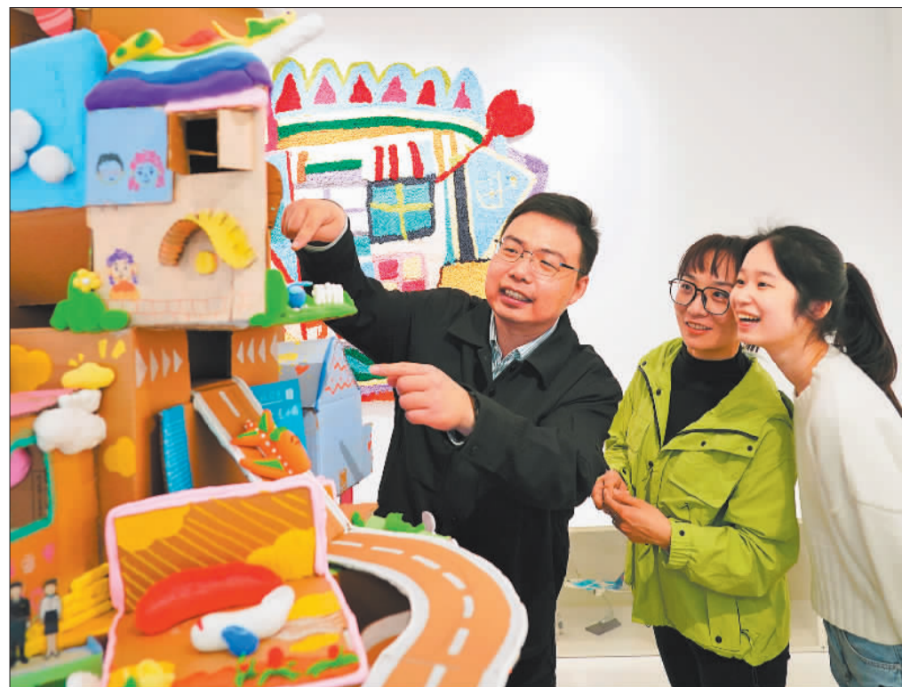
▲11月12日,市民在长宁区程家桥街道虹桥机场新村社区参与式博物馆参观。这里的展品均由居民以参与的方式共创共建。