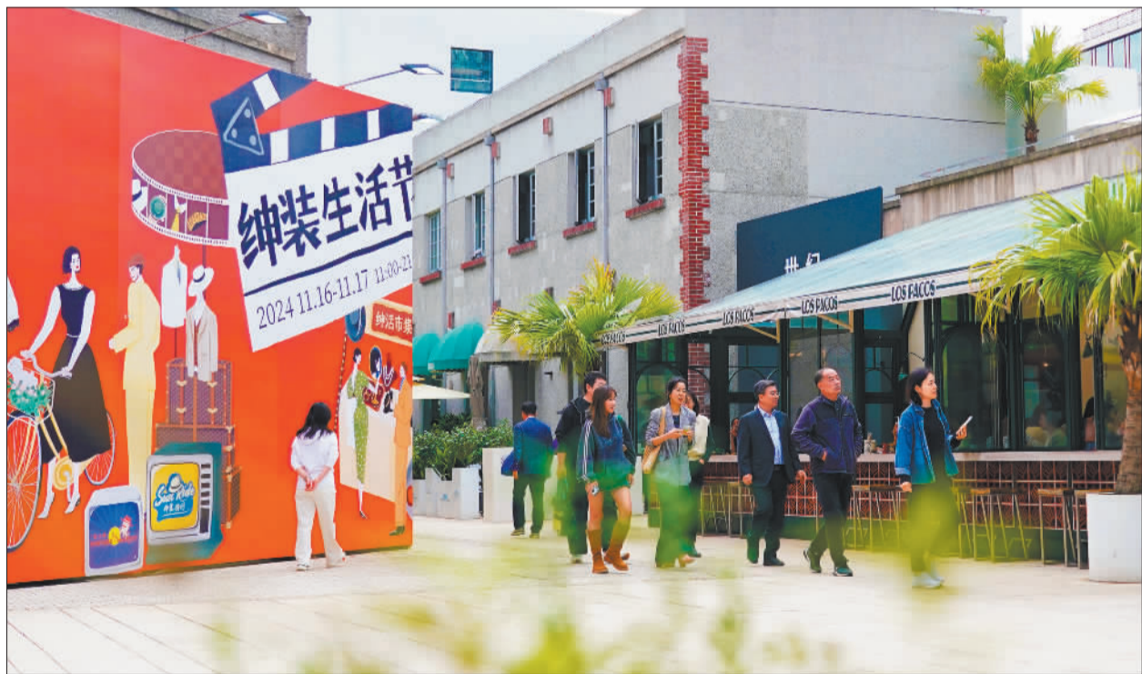
▲11月12日,市民在长宁区上生·新所园区内游览。位于新华路历史风貌区的上生·新所是一个有着百年历史的文化街区,改造后成为长宁区活力文艺新地标。