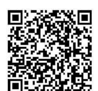
视频报道请扫二维码

无论收购成功与否，便利店行业朝着品牌连锁化、数字化和服务多样化方向发展的趋势不会改变。随着消费者需求的不断变化和市场竞争的加剧，便利店企业需要不断创新和升级。例如，通过推出更多新产品和自有品牌产品、优化供应链、提升店内环境和服务质量等方式，来增加附加值，改善消费体验；通过移动支付、智能货架、大数据分析等技术手段，来更好地了解消费者需求，提升运营效率。