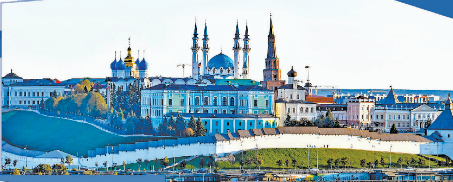
2024年9月23日拍摄的俄罗斯喀山克里姆林宫附近景色。