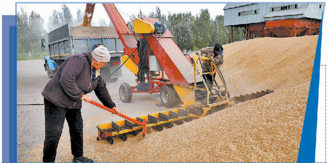
9月3日，在哈萨克斯坦首都阿斯塔纳附近，农民收获小麦。

记者：当前科技和投资正在农业产业发展中发挥着关键作用，并且贯穿了农业生产的整个链条。您如何看待发达国家与发展中国家之间的技术和资金鸿沟，对于弥合这一鸿沟有什么好的建议？