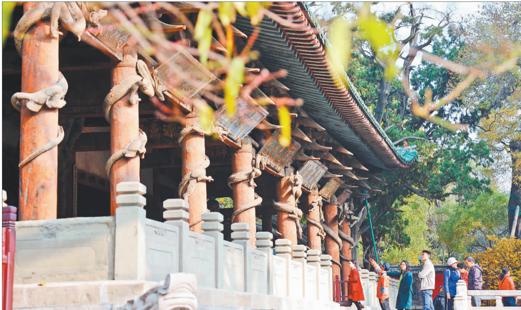
▲11月8日，游客在太原市晋祠博物馆参观游览。近年来，晋祠博物馆通过收藏保护、学术研究、宣传展示、社会教育等，全方位活化展现晋祠丰厚的历史文化资源。

资源、文化特色和群众需求，通过打造经典、智慧、群众、革命四类博物馆，形成了独具特色的博物馆集群。一座“馆城融合、人人共享”的现代化“博物馆之城”，正在为太原加快建设国内外重要文化旅游目的地增添强劲动力。