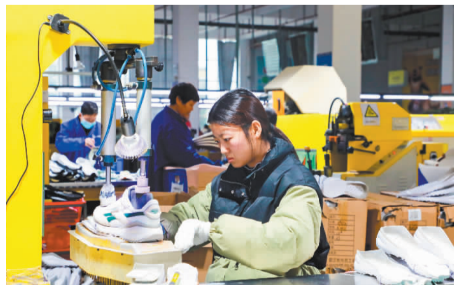
位于石城县的江西佰盈体育科技股份有限公司生产线上工人配合有序,现场一片繁忙。近年来,石城县品牌运动鞋服产业规模迅速扩大