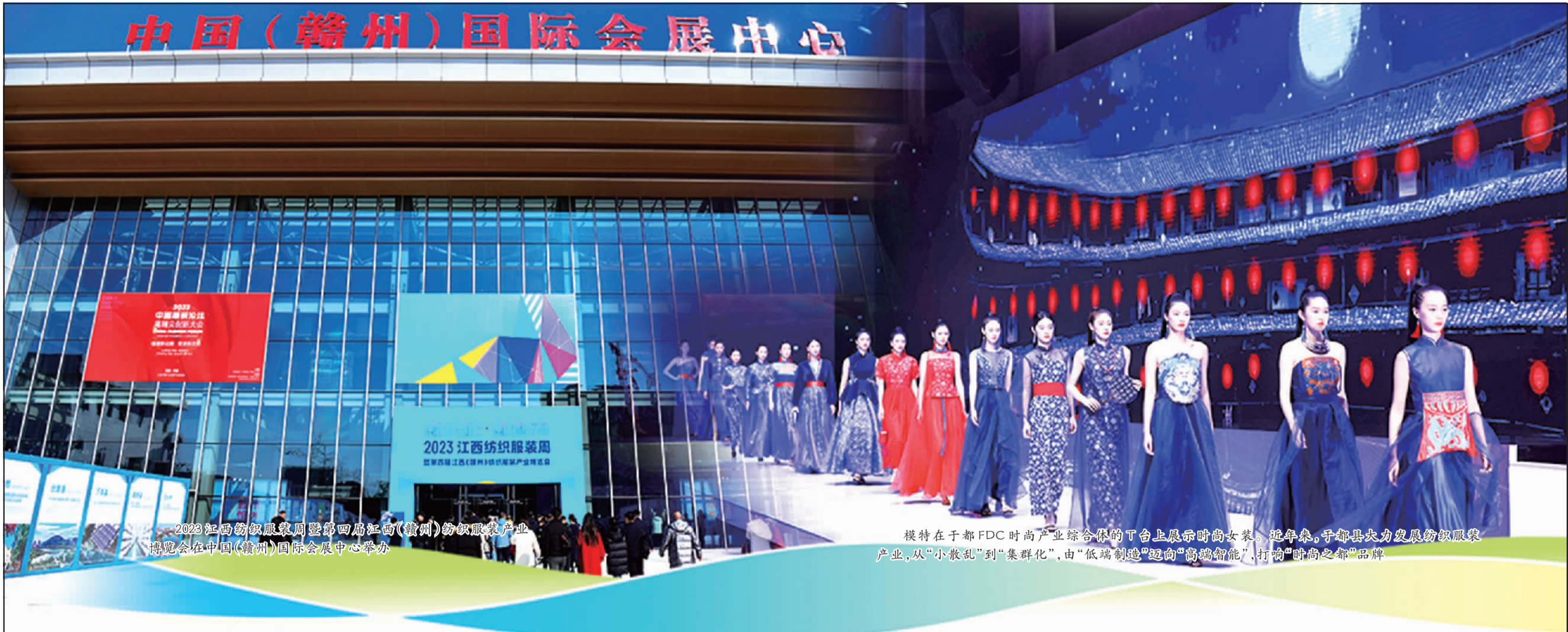
2023江西纺织服装周暨第四届江西(赣州)纺织服装产业博览会在赣州国际会展中心举办