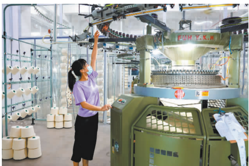
工人在洪兴(瑞金)实业有限公司生产车间操作。瑞金加快建成现代轻纺产业园,将打造首个赣南纺织服装印染数字化共享中心