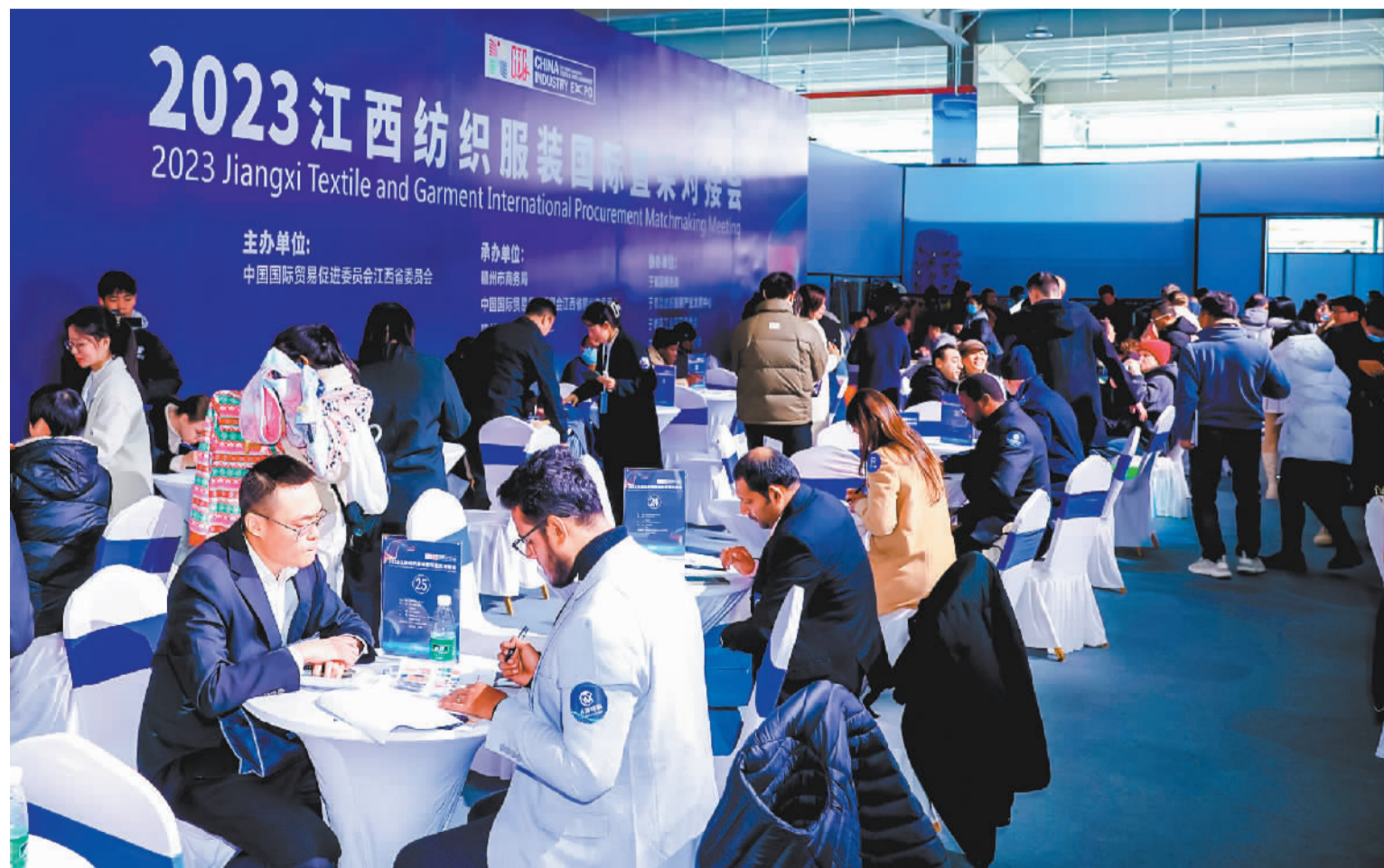
来自美国、西班牙等22个国家的采购商在2023江西纺织服装国际直采对接会上进行服装直采