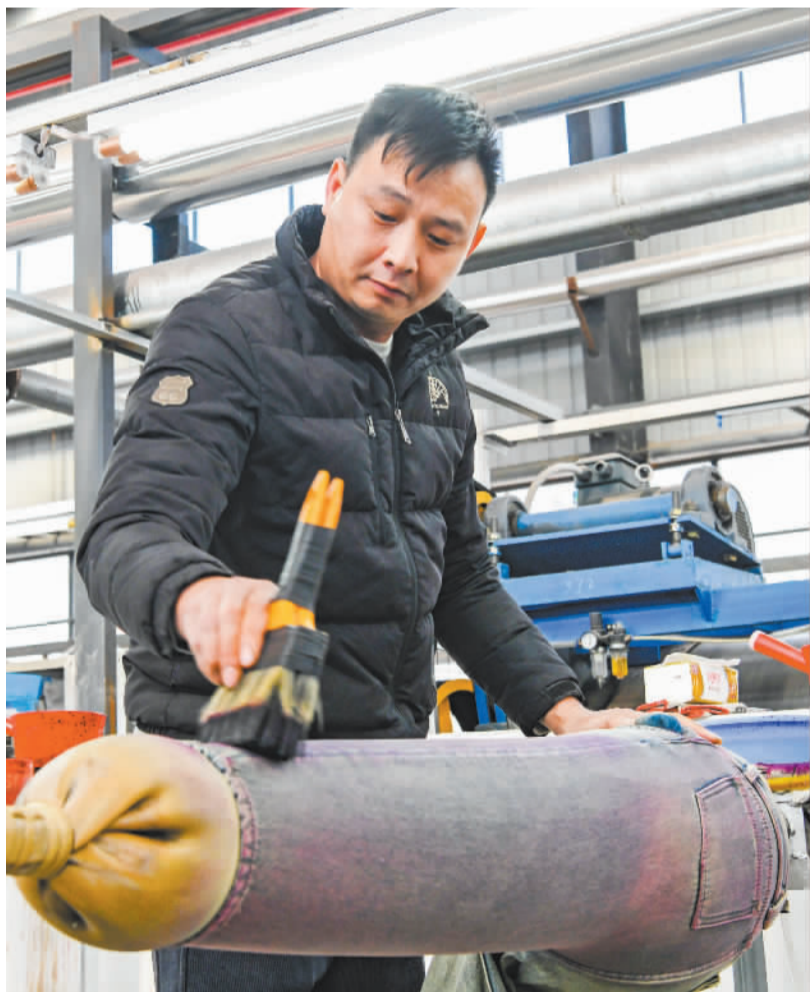
在位于兴国经开区的江西恒海洗水产业园内,工人使用扫描马骝工艺为牛仔裤染色