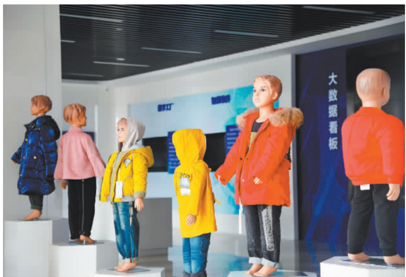
于都工业园区童装制造园内的童装展示。目前,于都县现上童装企业共有11家,年产值近12.5亿元

11月17日至20日,2024江西纺织服装周暨第五届江西(赣州)纺织服装产业博览会将在江西省赣州市于都县举办。近年来,江西省赣州市全面落实江西省制造业重点产业链现代化建设“1269”行动计划,将纺织服装产业列入重点打造的产业集群之一,深入实施纺织服装产业链长制,全市纺织服装产业基础不断巩固、规模不断壮大。2020年至2023年,赣州市纺织服装产业集群营业收入从960亿元增至1100亿元。