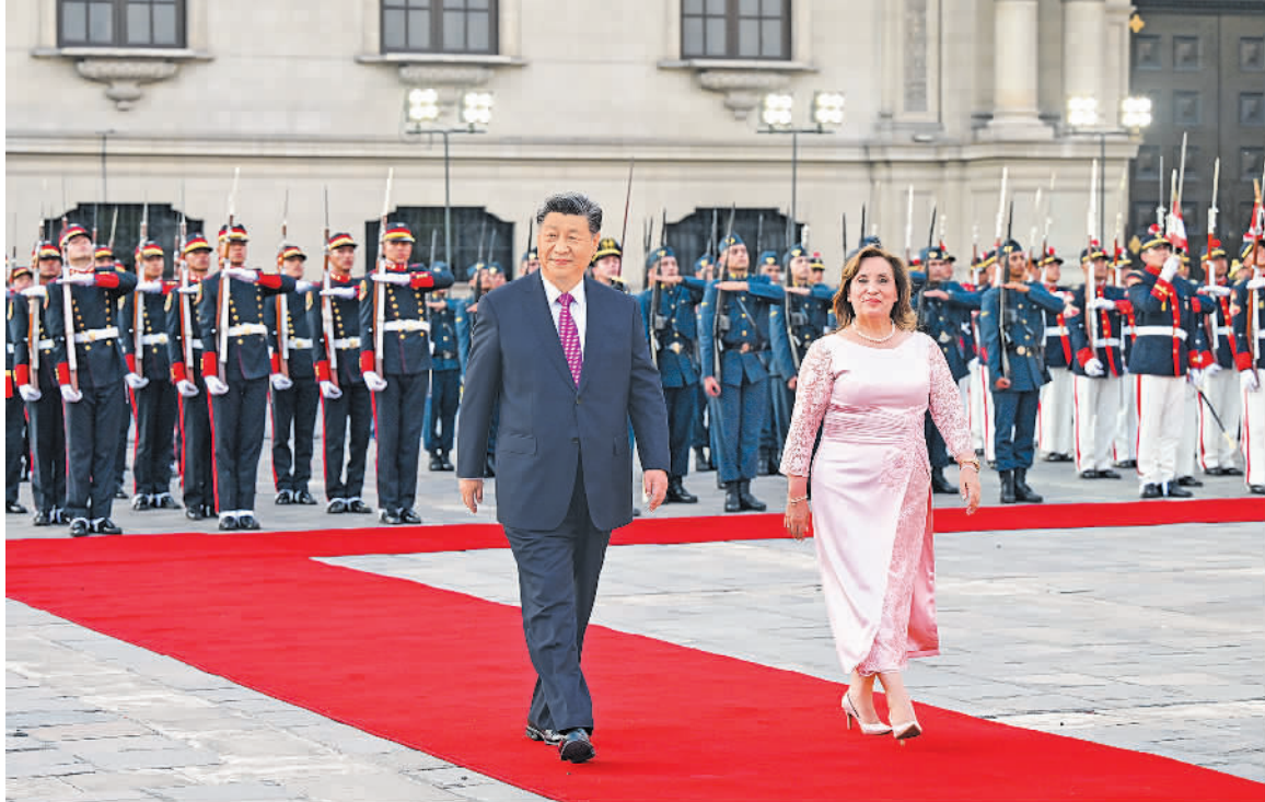
当地时间11月14日下午,国家主席习近平在利马总统府同秘鲁总统博鲁阿尔特举行会谈。博鲁阿尔特在总统府前广场为习近平举行隆重盛大欢迎仪式。