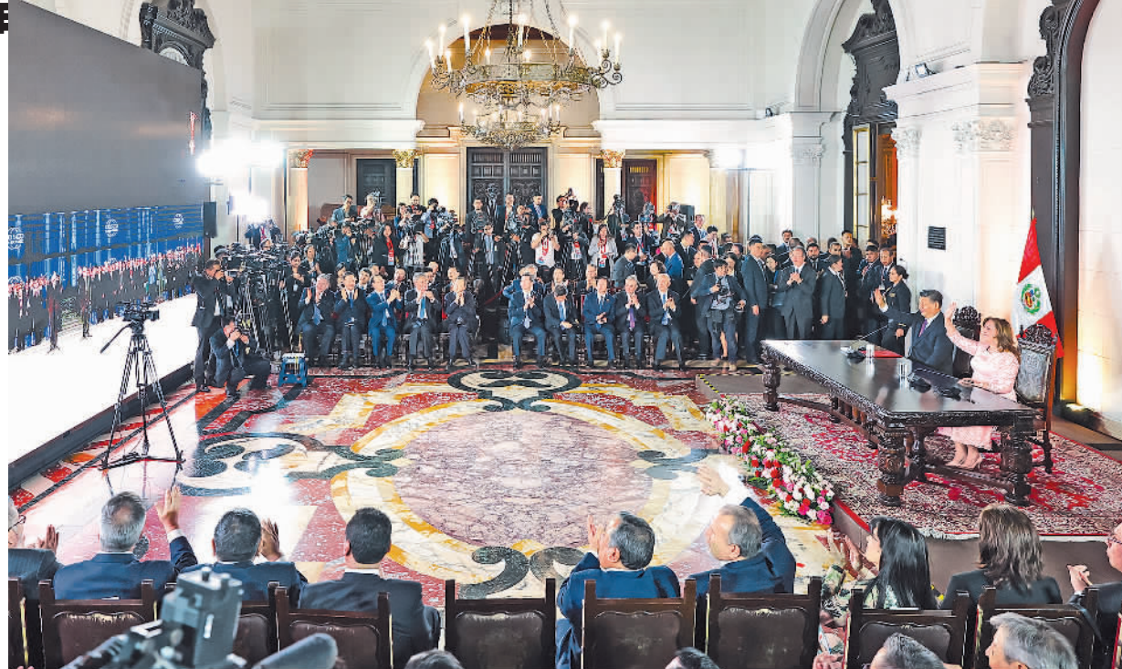
当地时间11月14日晚,国家主席习近平同秘鲁总统博鲁阿尔特在利马总统府以视频方式共同出席钱凯港开港仪式。