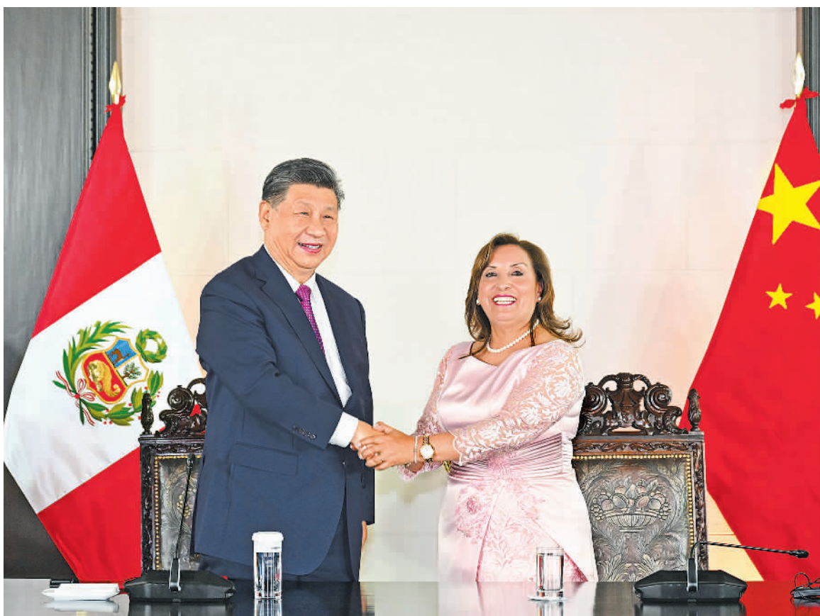
当地时间11月14日晚,国家主席习近平同秘鲁总统博鲁阿尔特在利马总统府以视频方式共同出席钱凯港开港仪式。